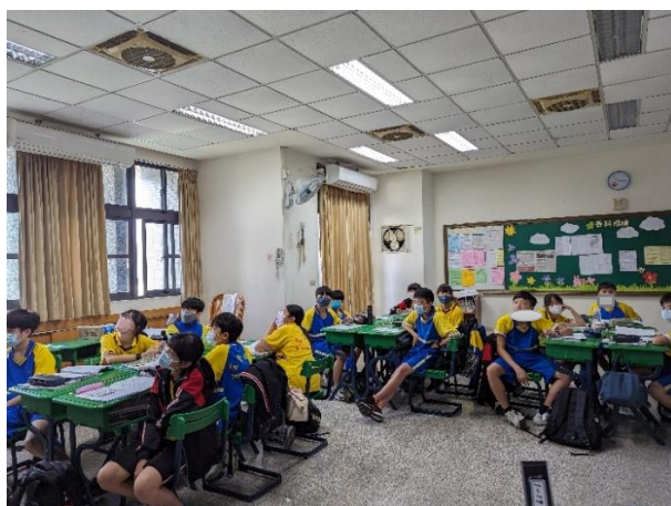
▲影片欣賞與有獎徵答(未戴口罩的學生正面，皆以色塊覆蓋)