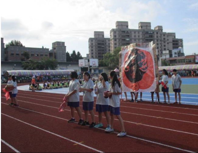
義民祭典盛事登場