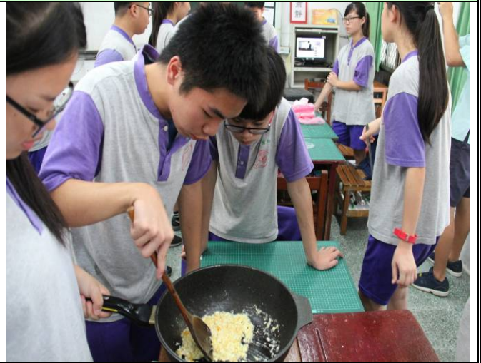
客家菜「鹹蛋苦瓜」其實炒起來不鹹也不苦