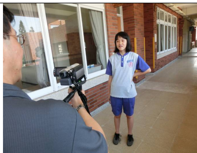
班上學習情緒高漲、充分利用課餘時間練習