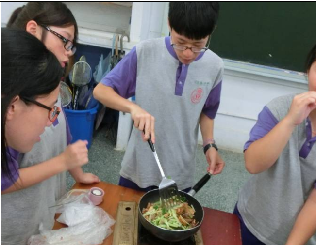
平民美食「客家小炒」最適合祭拜義民先祖