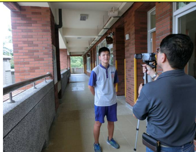
課後回饋訪談了解學習情形