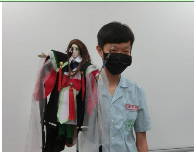
學生手工自製的布袋戲偶「義民英雄」