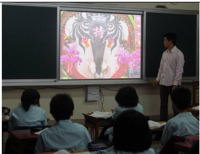
利用空白課程解說活動內容