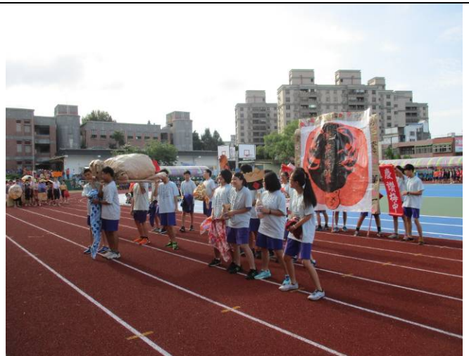
紙糊的大神豬繞境、祈求合境平安