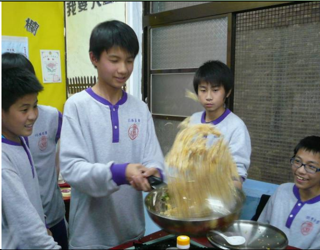
翻炒食材、樂在料理