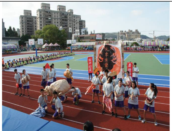
賽神豬獻祭、褒忠義民魂