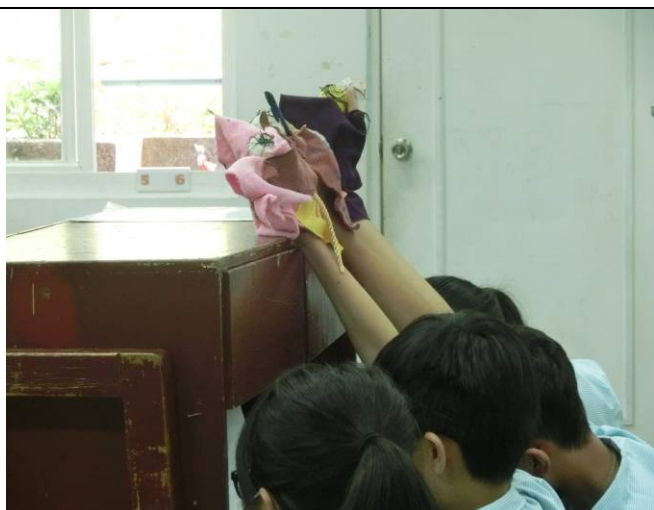
群策群力合作演出布袋戲