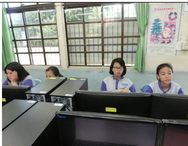
解答學生觀賞影片時所提問題