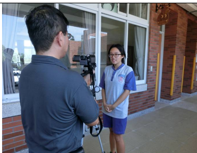
整體而言非常喜歡義民祭課程