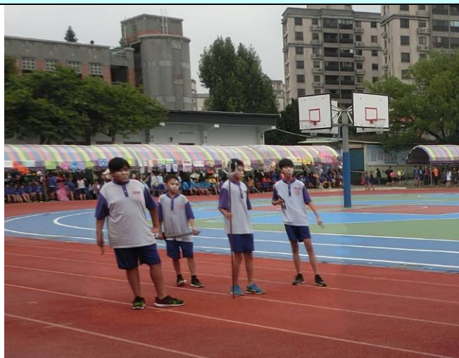
學生扮演將官首、只畫臉、不著裝