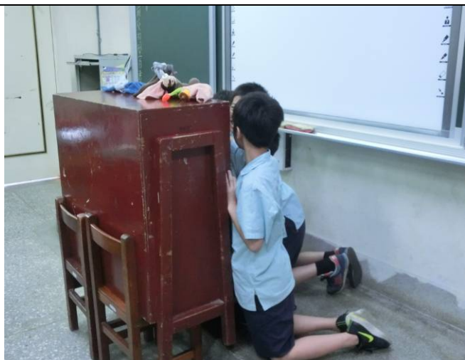
搭建布袋戲棚架、自願跪姿力求精采演出