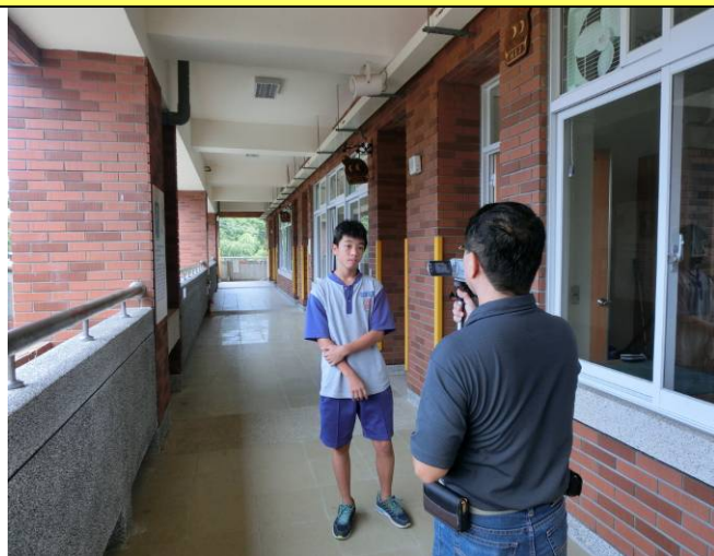
義民祭課程有助於了解文化