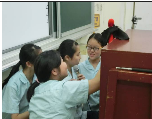
幕後配音、一人分飾多角