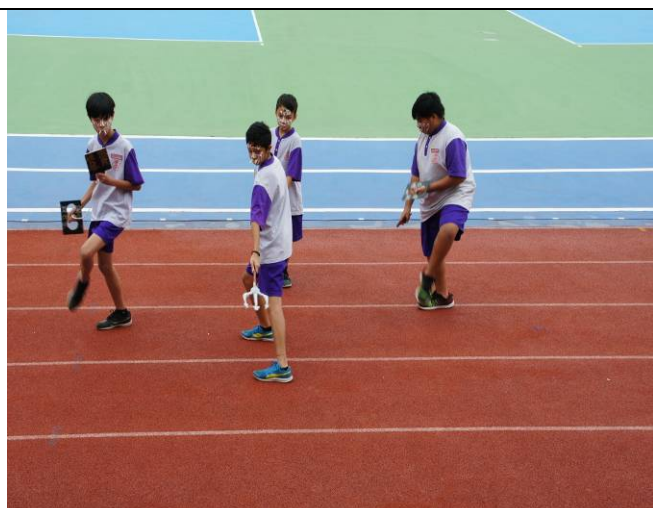
手持法器刑具、嚇阻妖魔鬼怪