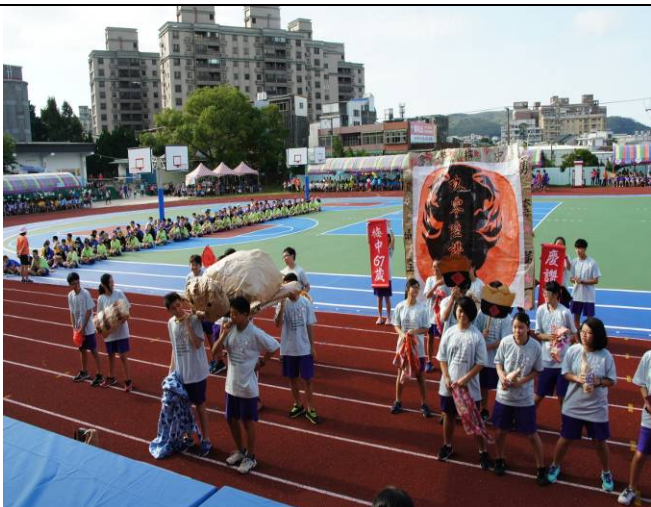
賽神豬與彩飾神豬皮為義民祭典中的特色習俗