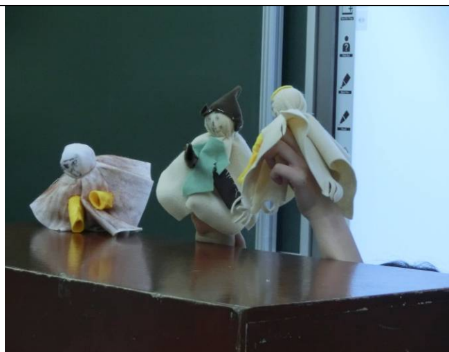
「酬神布袋戲」教忠教孝、發揚義民精神