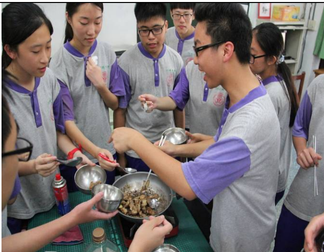
分食祭拜後的「客家鹹豬肉」代表分享福氣