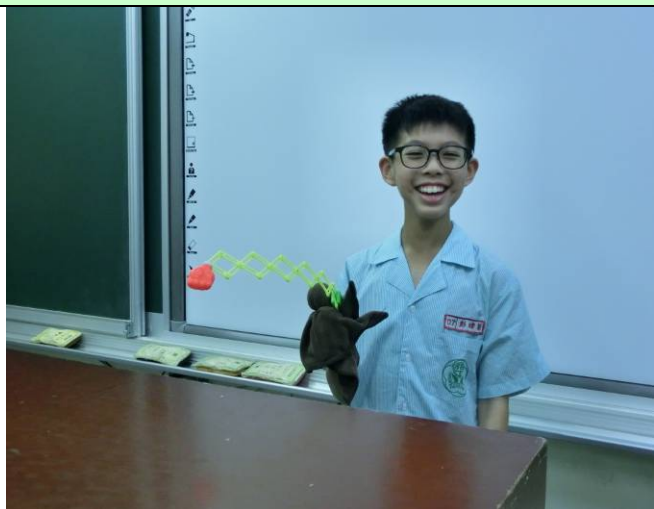
應用玩具製作有「戰鬥力」的布袋戲偶