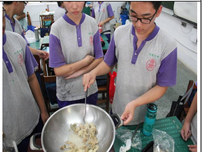
「薑絲炒大腸」是又酸又嗆的客家經典菜