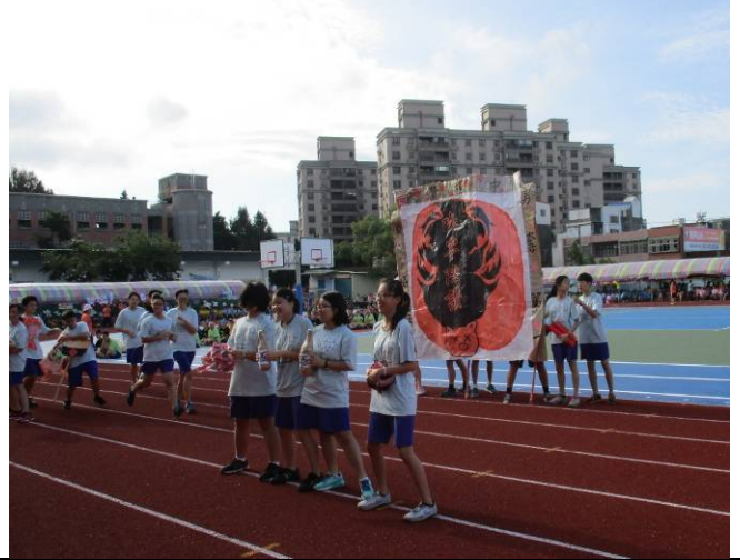
神豬競賽獲獎後殺豬獻祭