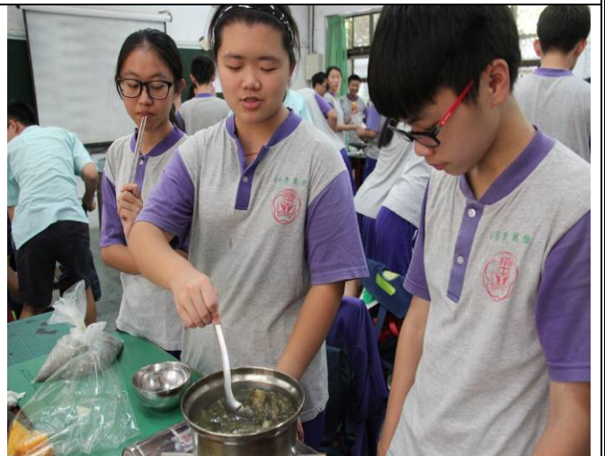
搭配最具客家代表性的「福菜肉片湯」才夠味