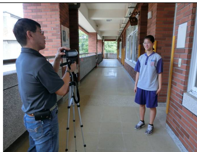
需配合校慶、課程稍嫌緊湊