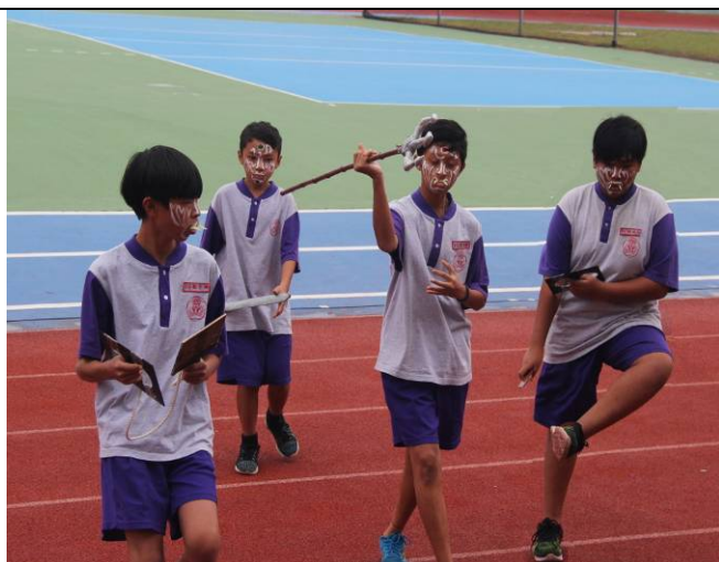
東西南北四面巡走