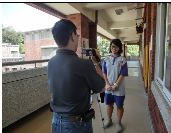
分組合作學習經常手忙腳亂