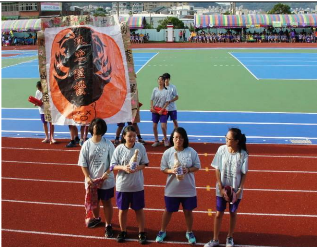
神豬皮彩飾後以支架撐起展示、彰顯義民威武