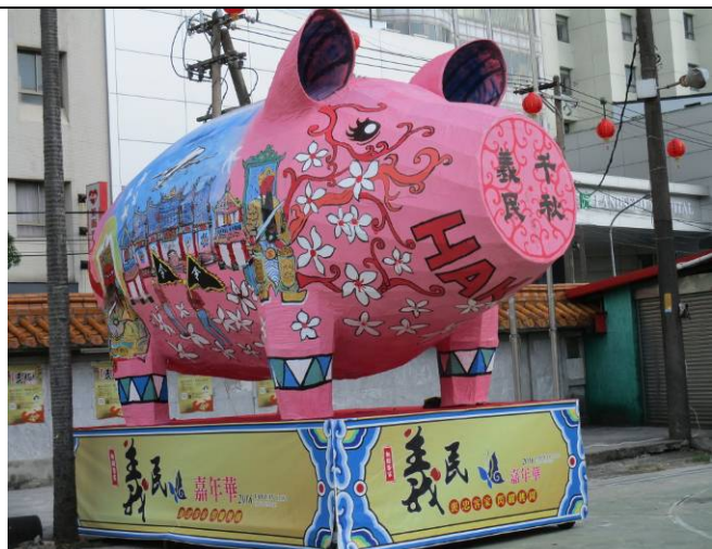
因應動物保護觀念、改紙糊或替代品製作神豬