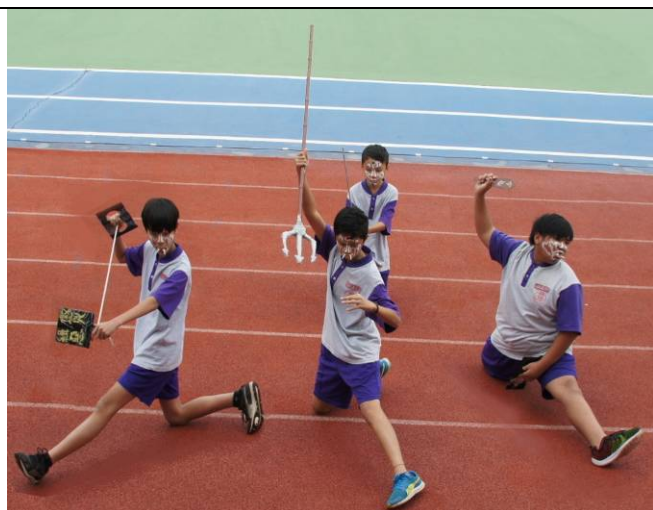
官將首恭迎義民爺安座