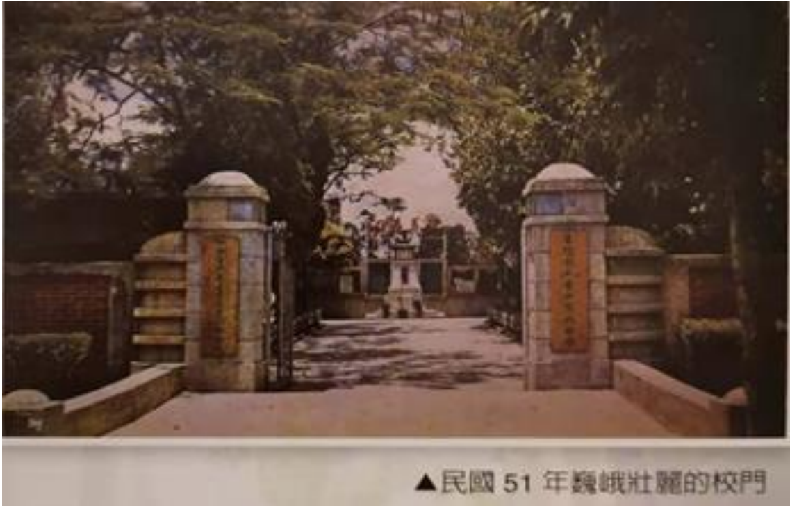
▲民國 51 年巍峨壯麗的校門

1946 年一月「省立臺中第二中學」與「省立臺中第二女中」合併，於二女中校址（今英士路校地）復校。開始光復後第一屆初中、高中部一共六個班的招生，至當年 12 月 25 日正式復校，往後此日便成為本校之校慶日。