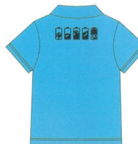
成人男款-未來藍背面