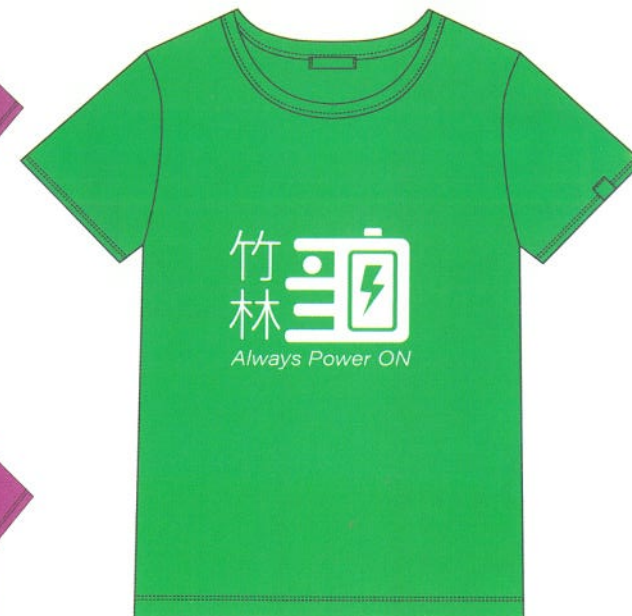
兒童款-竹林綠正面