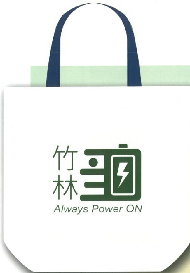
竹林100紀念提袋正面