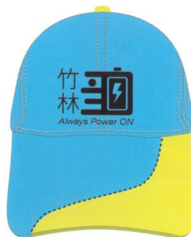
運動帽-未來藍螢光黃