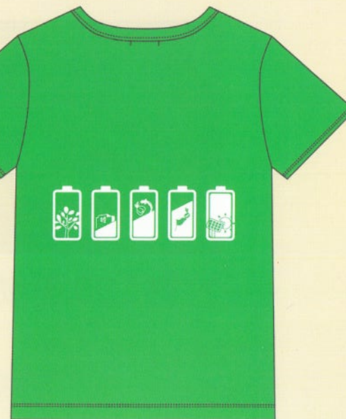
兒童款-竹林綠背面