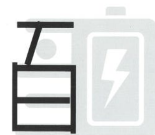
1-3 黑線部分為LOGO中百字樣意涵