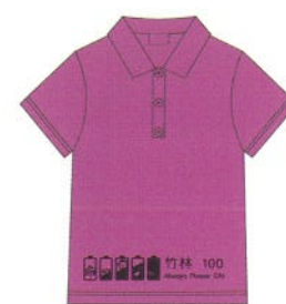
成人女款-幸福粉正面