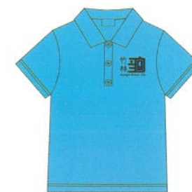
成人男款-未來藍正面