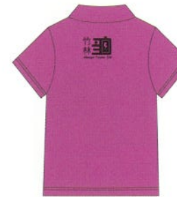
成人女款-幸福粉背面

本次文創商品種類包含成人紀念POLP衫(男女各一款)、兒童紀念T恤、運動帽、運動毛巾以及竹林100紀念提袋。