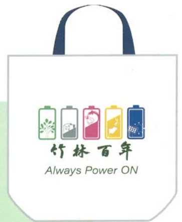
竹林100紀念 提袋背面