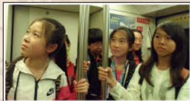
畢業旅行-高雄捷運