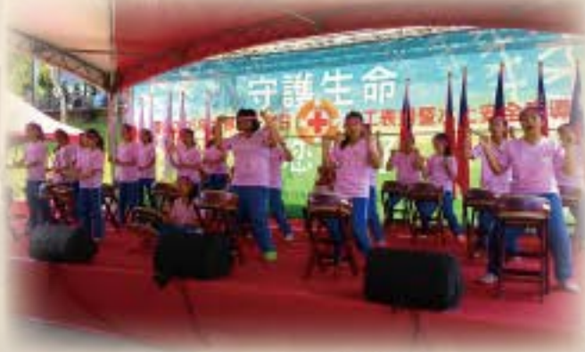
台北碧潭太鼓表演