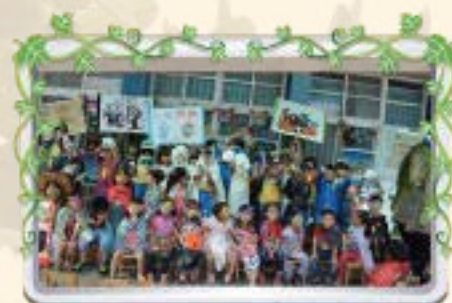
與國小部哥哥姊姊一起慶祝萬聖節