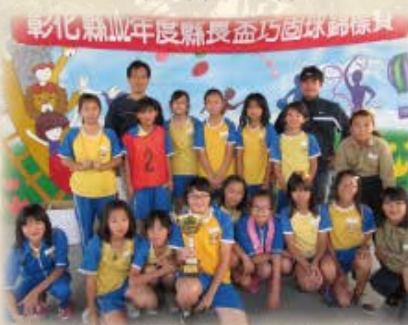
102. 11. 19縣長杯巧固球比賽女子第一名