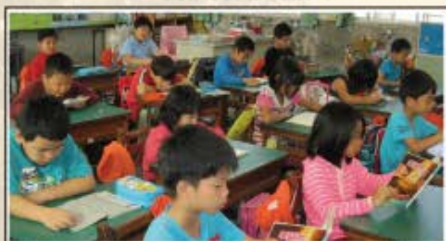
美好的晨間共讀時光