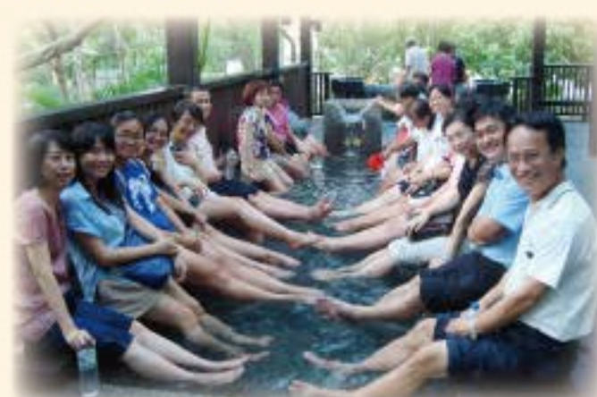
教職員環境教育活動