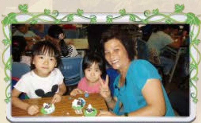
游玉美代表與孫子的作品