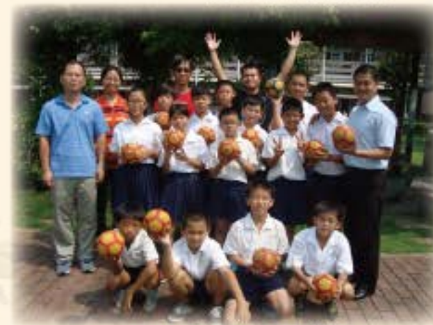
104年六年級巧固球隊