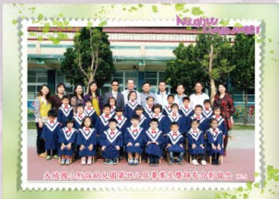
大城國小附設幼兒園第廿八屆畢業生暨師長合影留念 102.4