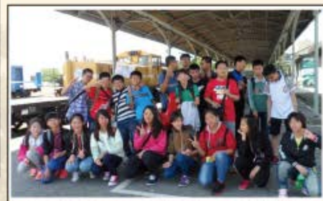
畢業旅行-打狗鐵道文化館