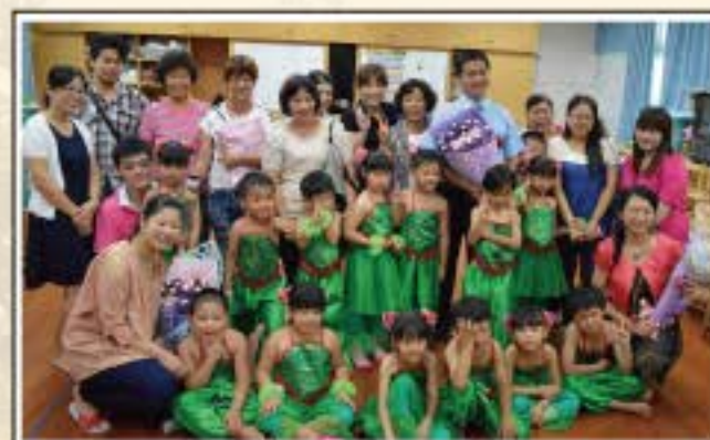
畢業囉-謝謝校長主任及老師的指導