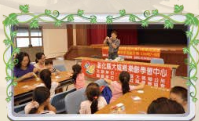
巫館長示範如何捏出可愛羊咩咩