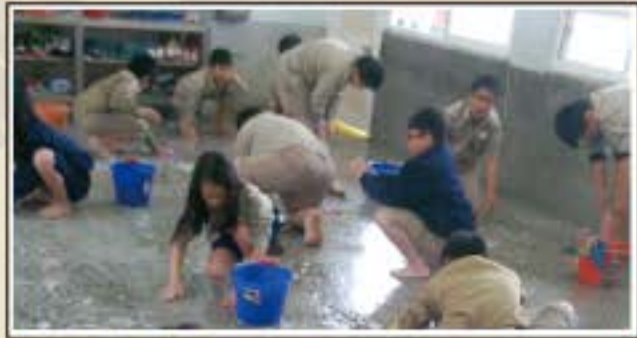
為了能在教室脫鞋上課，我們正努力把地刷乾淨