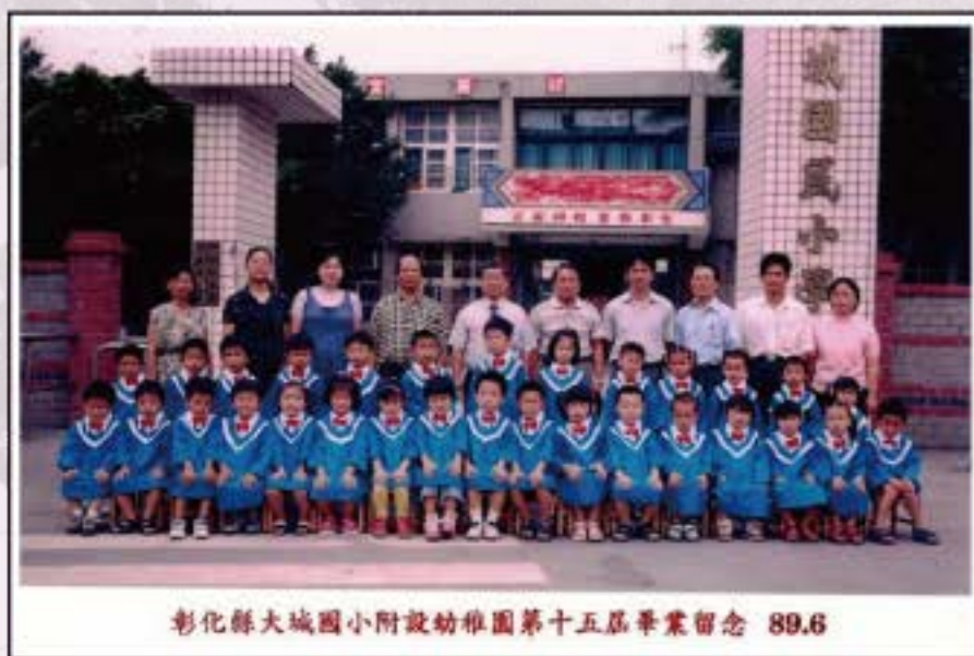
彰化縣大城國小附設幼稚園第十五屆畢業留念 89.6