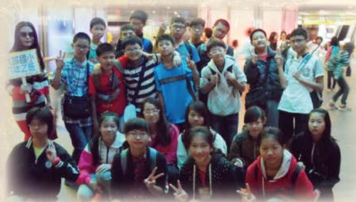
畢業旅行 (高捷美麗島站)