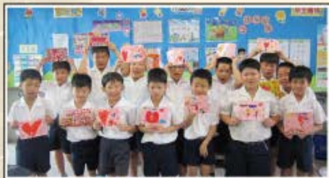
男孩們的母親節卡片