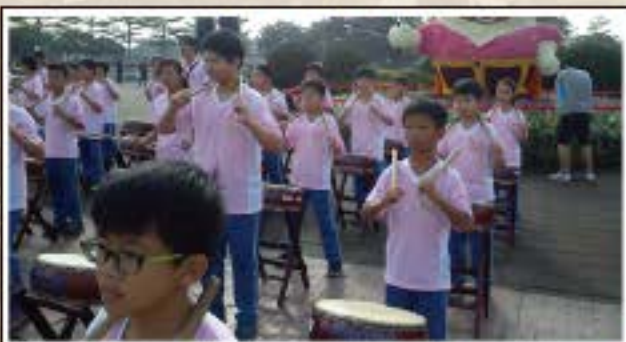
花博公園太鼓表演