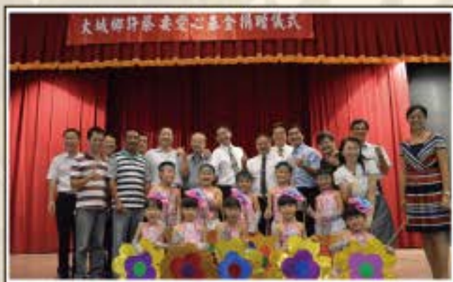
許蔡要愛心基金捐款儀式與長官合照