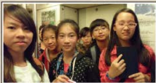
畢業旅行-高雄捷運