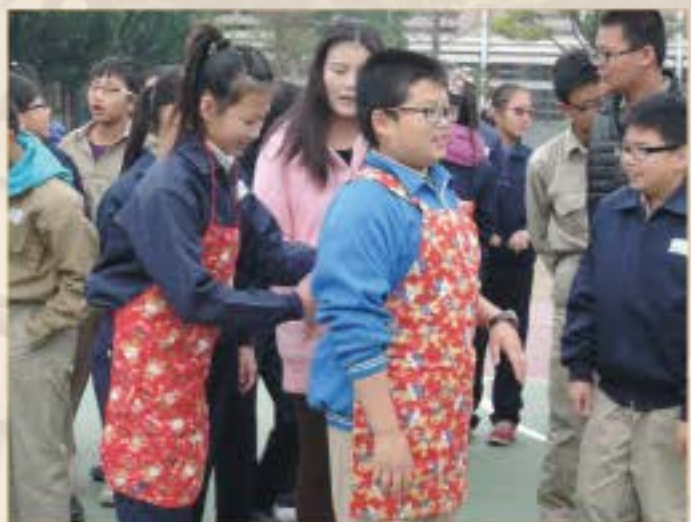
性別平等主題體驗