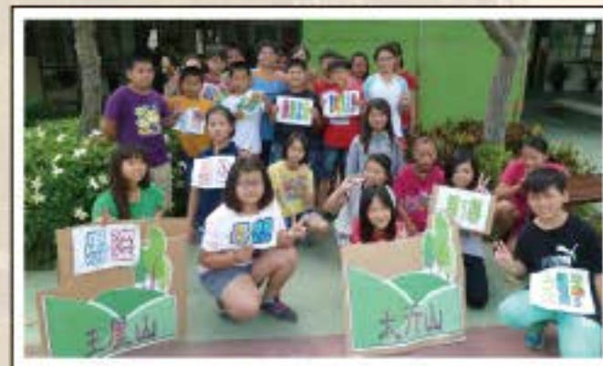
愚公移山-成功演出