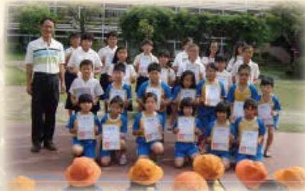
校內跳繩比賽表揚 頒獎中小聯運得獎的同學