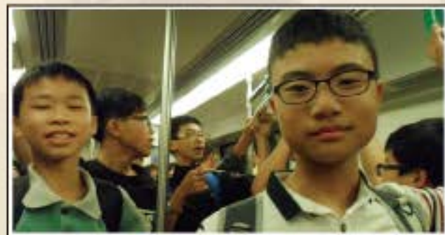
畢業旅行-高雄捷運