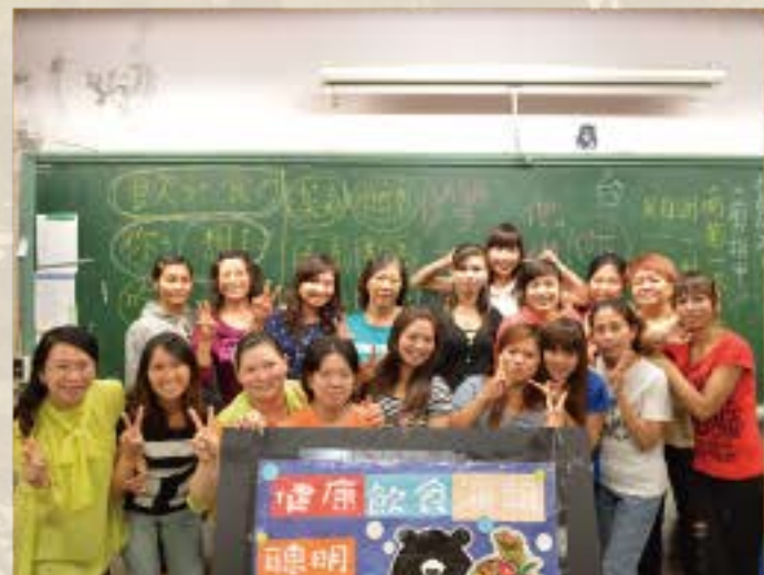
外籍配偶及成人識字班