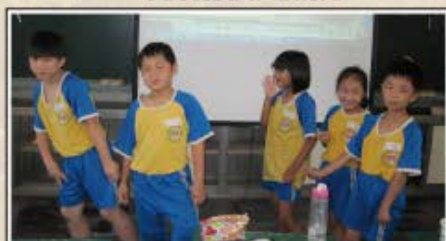
雨天狀況劇雨衣太長篇