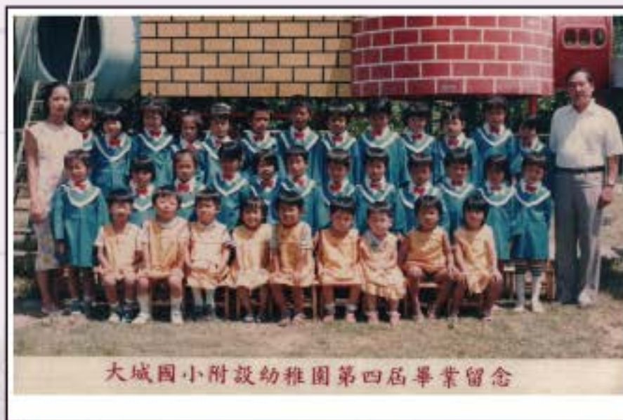
大城國小附設幼稚園第四屆畢業留念