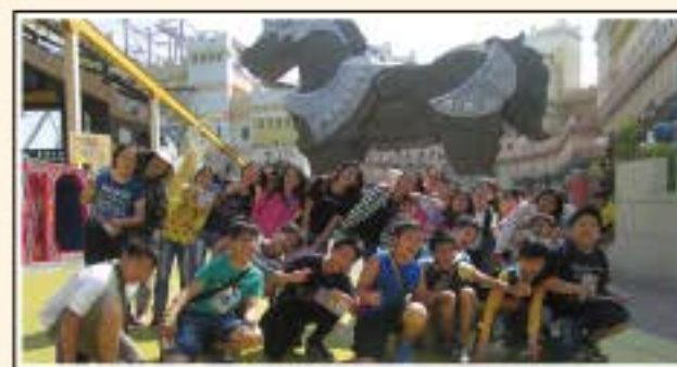
準備在義大世界玩翻