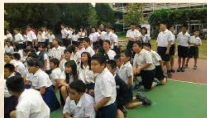
手忙腳亂折衣服，有意思的家庭主題日活動