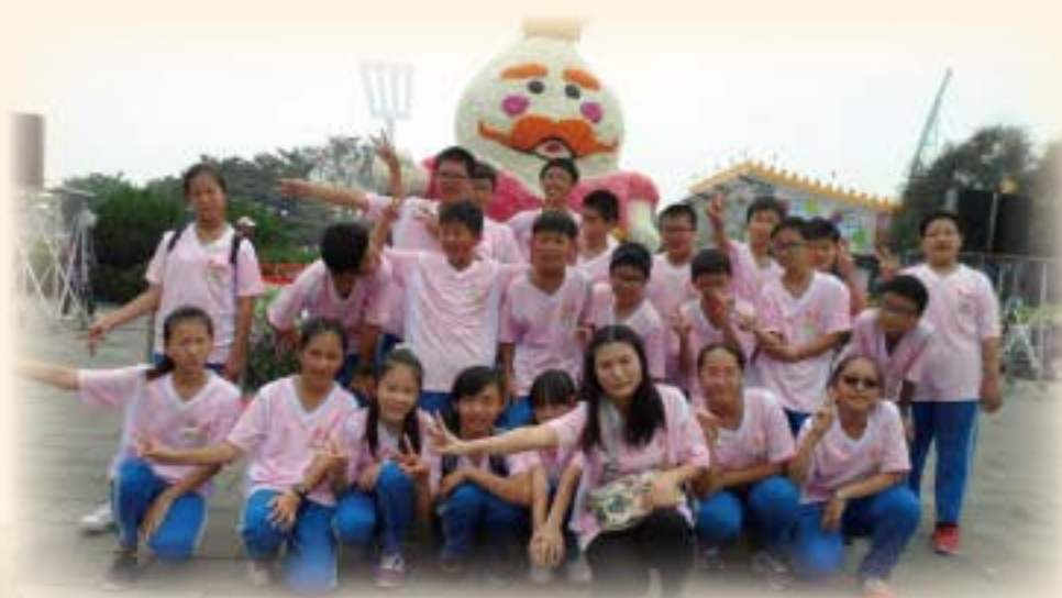
太鼓表演 (溪州費茲洛公園)