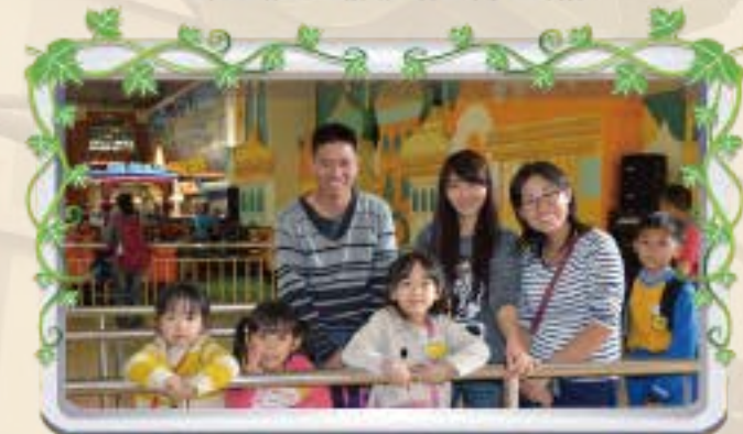
遊樂場等待進場遊戲囉!