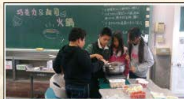
巧克力火鍋和起司火鍋登場囉