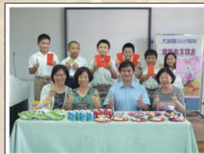
慈緣基金會英語補救教學