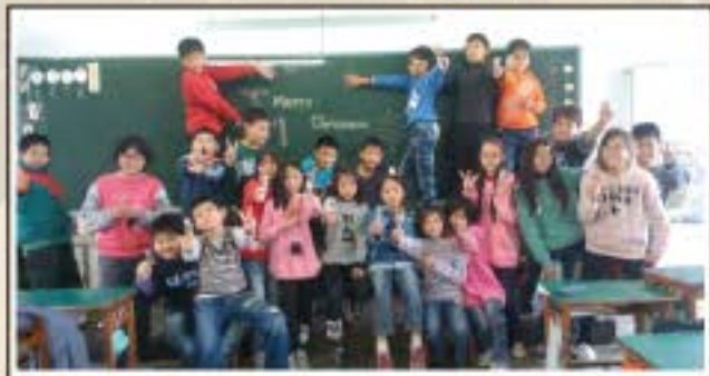
聖誕節找糖果活動，老師太會藏，讓我們找的好辛苦