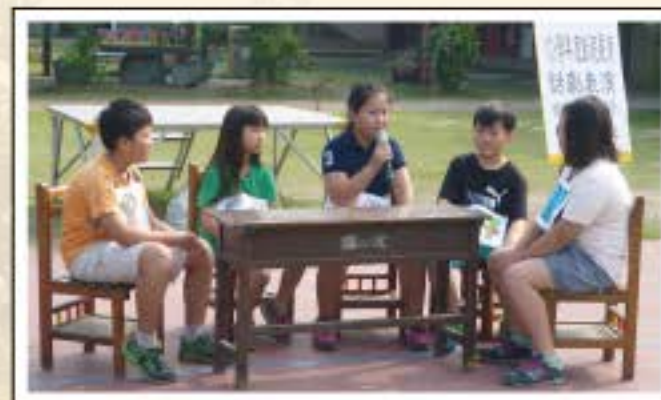
愚公移山-家庭小組會議