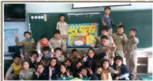
我們自己製作的海報精緻又美觀