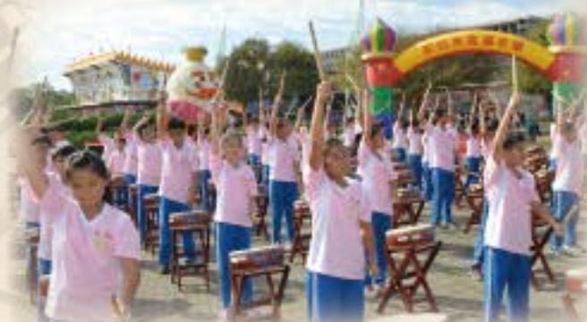
彰化縣草地音樂會太鼓演出精彩