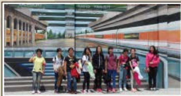
畢業旅行-駁二特區