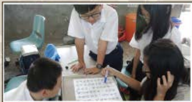
作文賞析-小組討論+修正