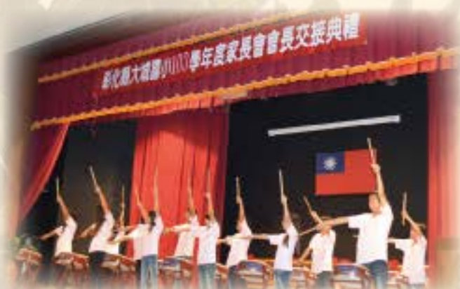
會長交接太鼓表演