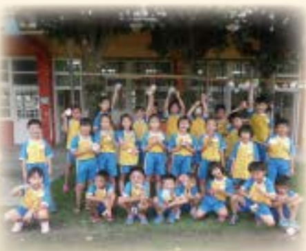
我的百年校慶祈福卡讚啦！