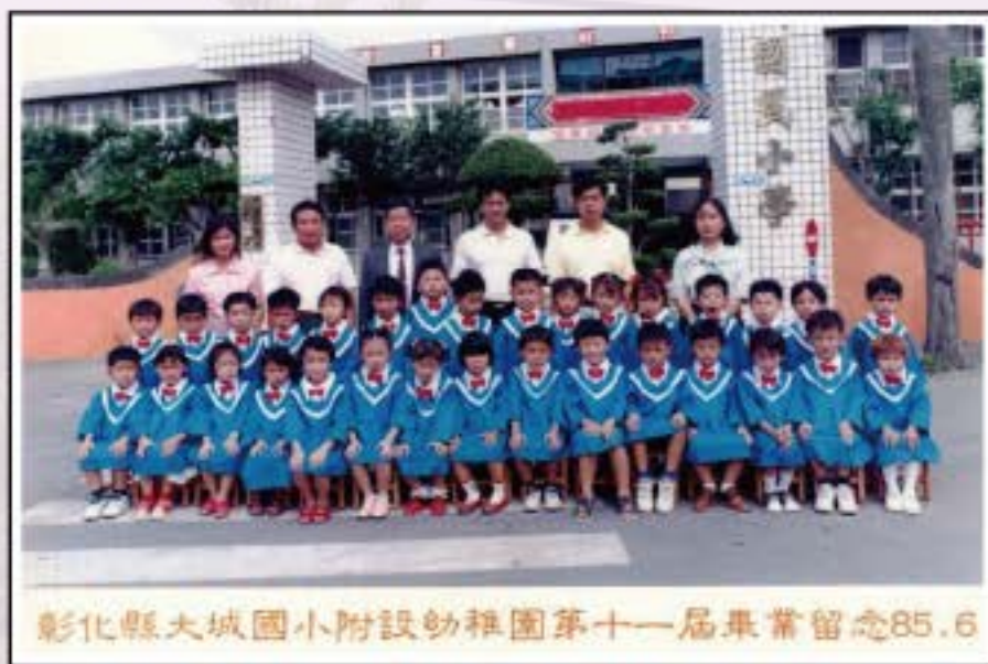
彰化縣大城國小附設幼稚園第十一屆畢業留念85.6