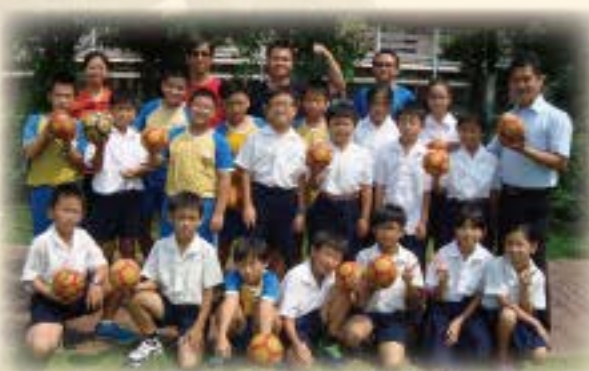
104年五年級巧固球隊