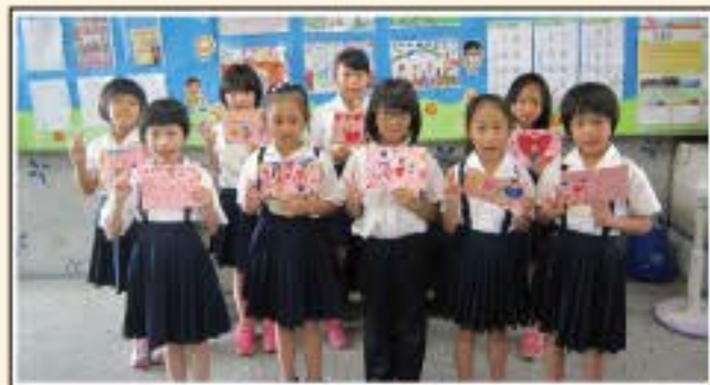
女孩們的母親節卡片