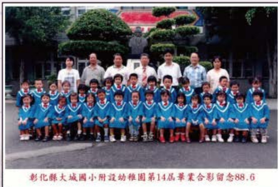
彰化縣大城國小附設幼稚園第14屆畢業合影留念88.6