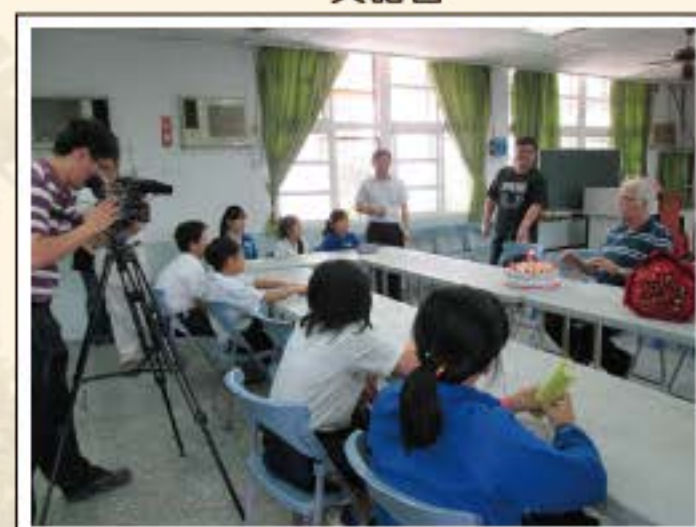
外師英語視訊活動