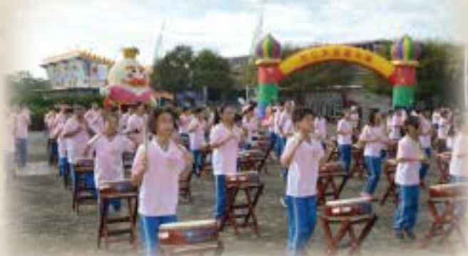
彰化縣草地音樂會精彩太鼓演出