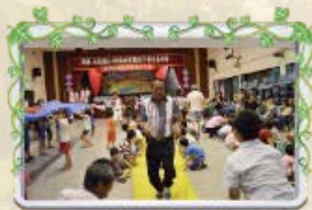
來坤會長示範 快樂向前衝體能活動