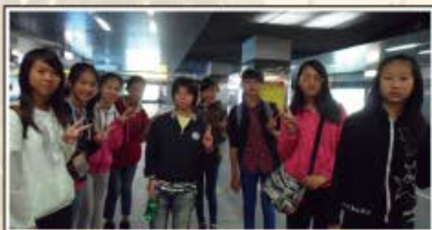
畢業旅行-高雄捷運