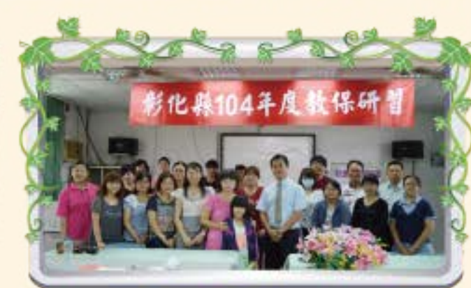
彰化縣104年度教保研習 性別平等教育研習-艷紅校長、松圳校長與學員一起合影