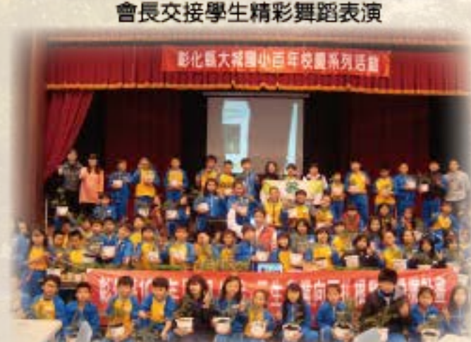
農入生活環境教育