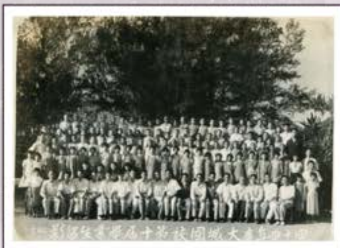
民國三十四年大城國校第十屆畢業生合影紀念