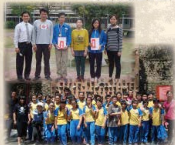
學生攀岩活動 合影