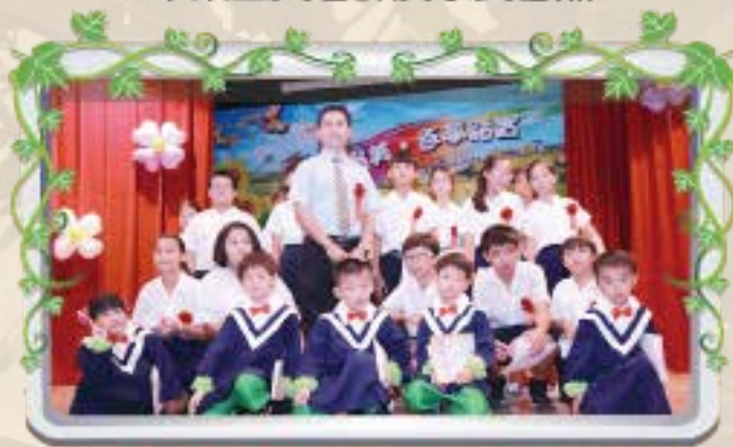
畢業生與校長合影