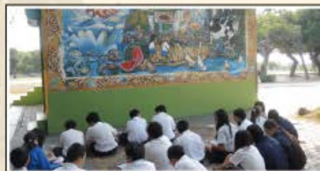
視覺摹寫練習-觀察校園壁畫