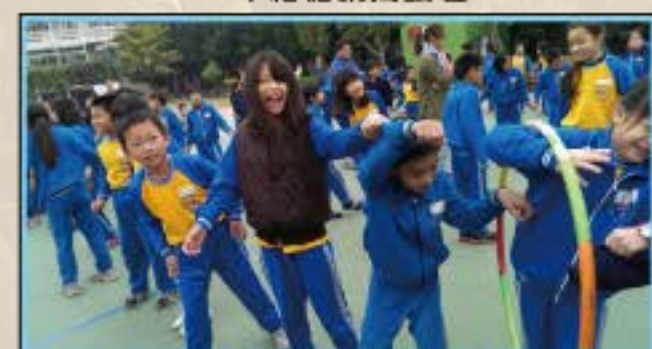
我也笑得太燦爛了吧