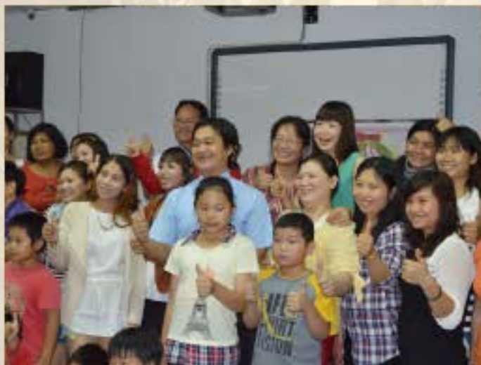
外籍配偶及成人識字班