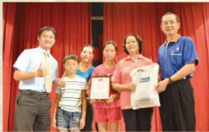
祖孫三代共學表揚