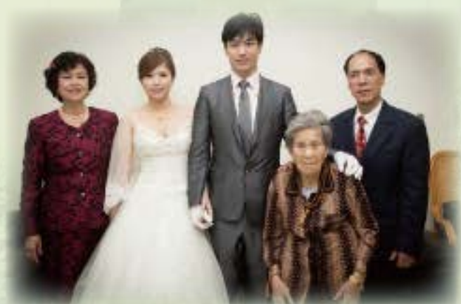
101.1.17 - 兒子結婚