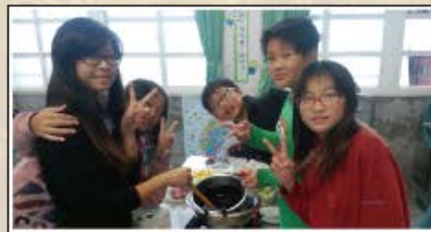
我們正在煮巧克力火鍋