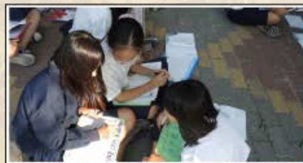
視覺摹寫練習-透過小組討論把所觀察的壁畫描寫出來