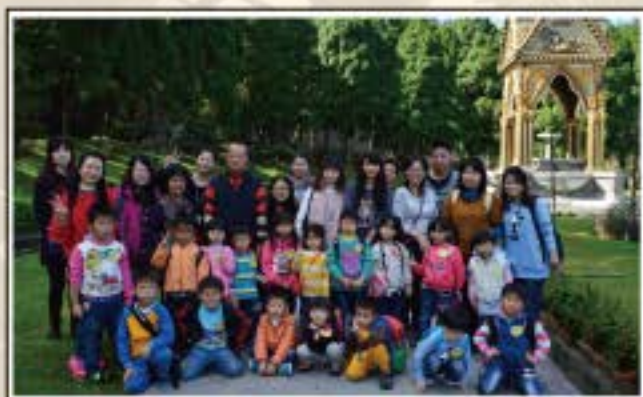
九族文化村戶外教學