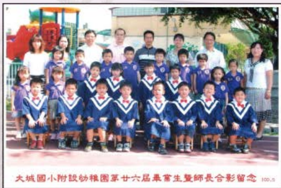
大城國小附設幼稚園第廿六屆畢業生暨師長合影留念 100.2