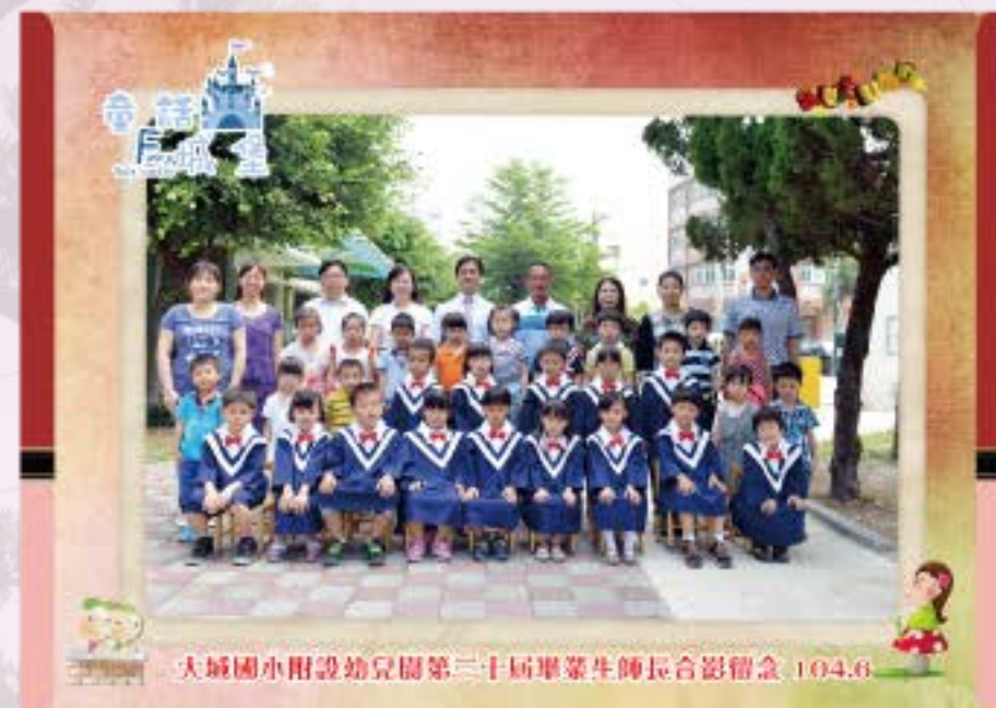
大城國小附設幼兒園第三十屆畢業生師長合影留念 104.6