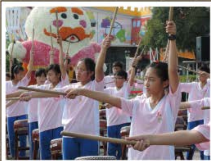
紅十字會太鼓表演