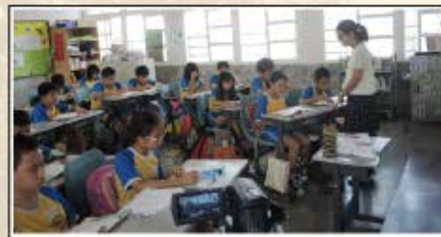
我們認真上課的模樣-第一次上課錄影的我們其實很緊張