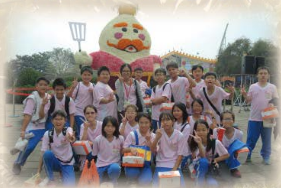
費茲洛公園表演太鼓後