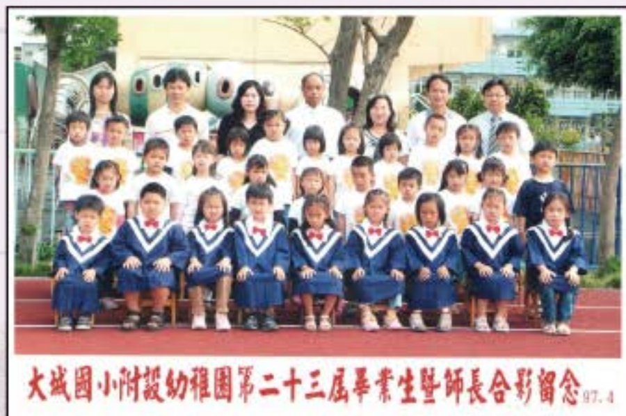
大城國小附設幼稚園第二十三屆畢業生暨師長合影留念 97.4