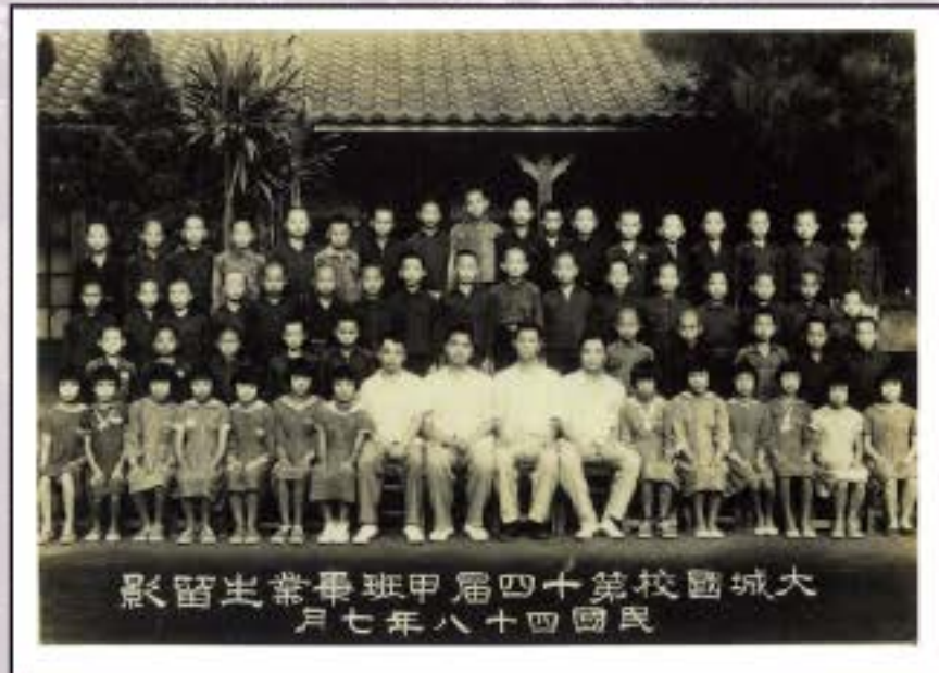
大城國小第四十屆甲班畢業生留影 民國四十八年七月