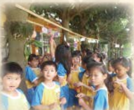
一起掛祈福卡真開心