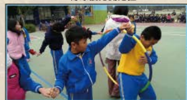
看我靈活地穿過呼拉圈