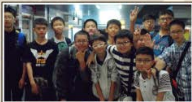
畢業旅行-高雄捷運