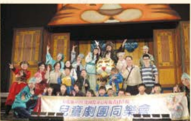
資源班參觀兒童劇團