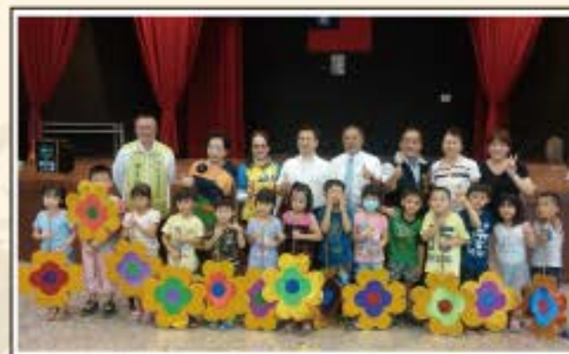
感謝縣長與議員們對幼兒的關懷與照顧