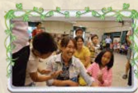
小朋友為媽媽按摩 慰勞媽媽的辛勞