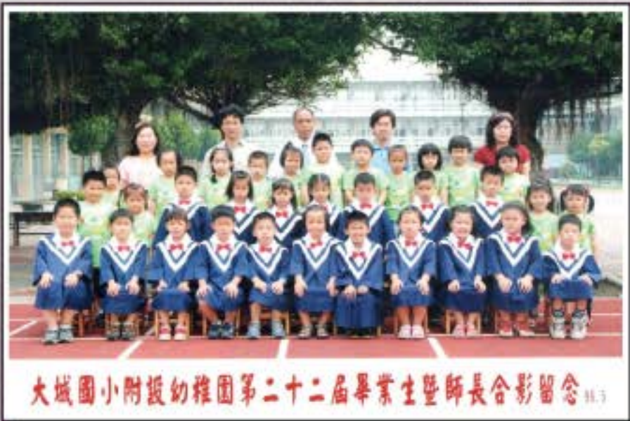
大城國小附設幼稚園第二十二屆畢業生暨師長合影留念 96.3