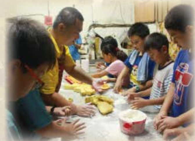
四健會到瑞益餅店DIY