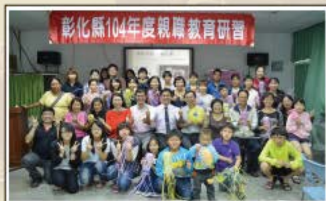
親職教育活動合照