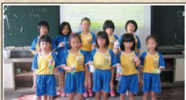
女孩們演奏環保樂器