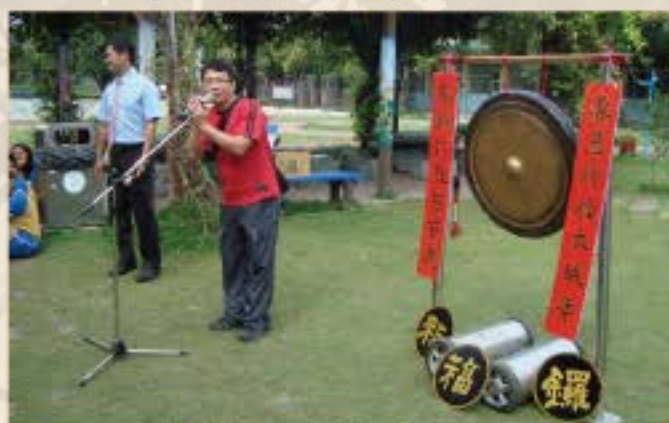
全校感恩祈福活動