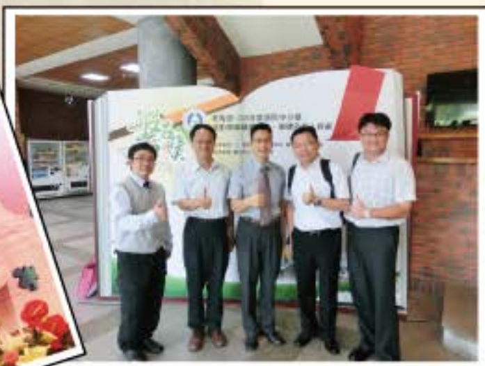
參加閱讀磐石獎頒獎典禮