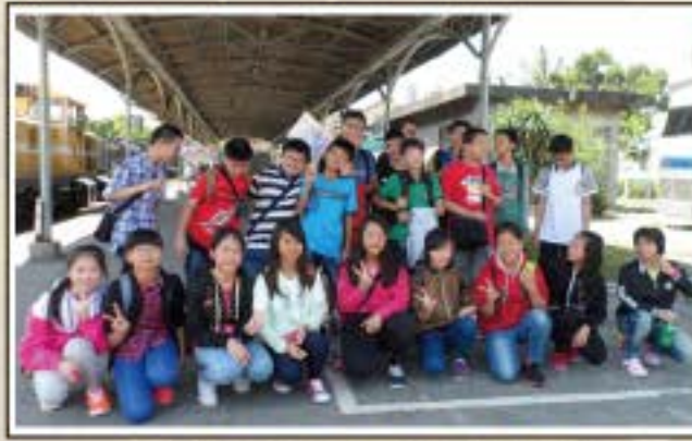
畢業旅行-打狗鐵道文化館