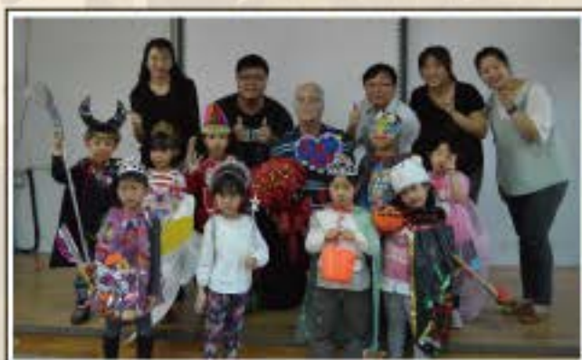
麥克爺爺生日快樂