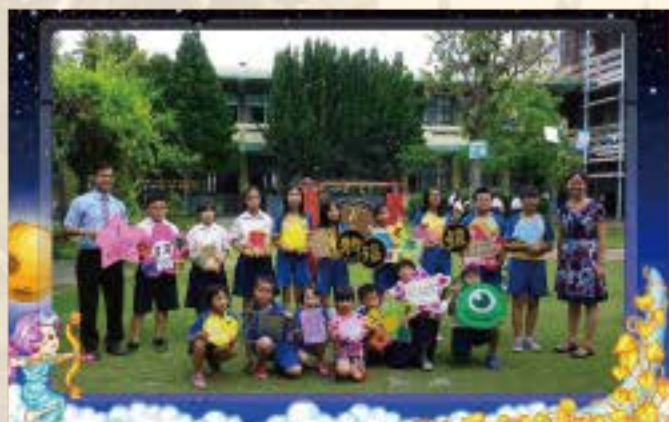
全校祈福代表合照