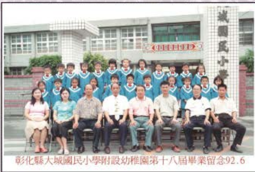
彰化縣大城國民小學附設幼稚園第十八屆畢業留念92.6