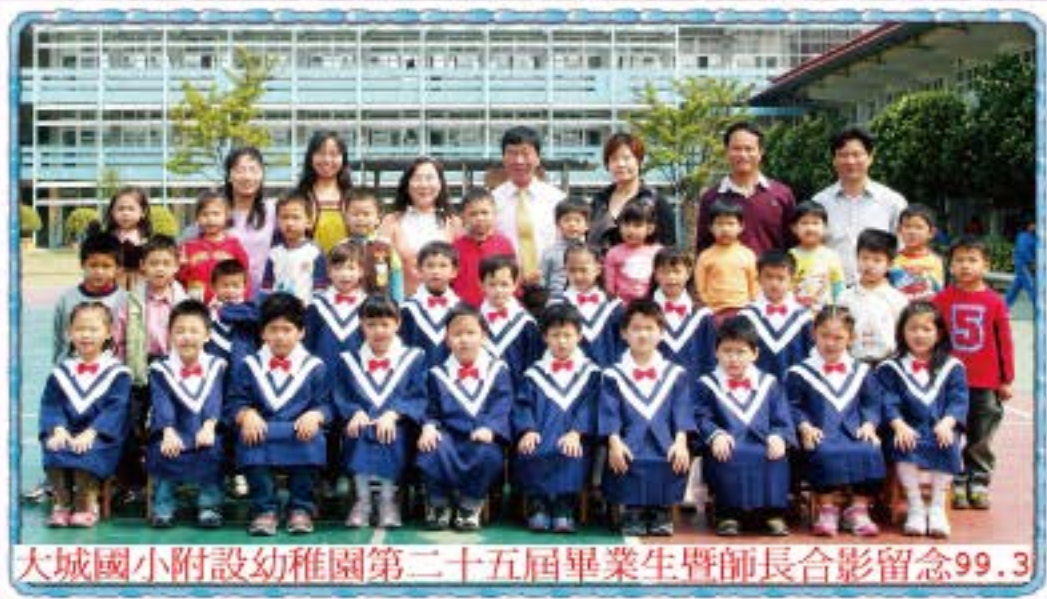
大城國小附設幼稚園第二十五屆畢業生暨師長合影留念 99.3