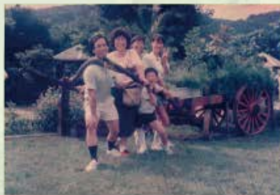
同心協力 合家歡 77.6(進世 41歲)

那時候體育課或課餘活動，同學最喜愛騎馬打仗遊戲。每一組選一較瘦小同學騎坐在較高大同學肩膀上，分兩組或數組混合比賽，坐在上面同學用手相互扭打，下面同學雙手護住頂上同學的雙腳，站穩兩腳並配合上面扭打移動，誰能撐到最後不倒就是冠軍。