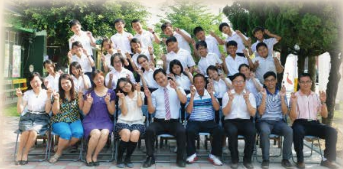
和我們一起裝可愛吧！