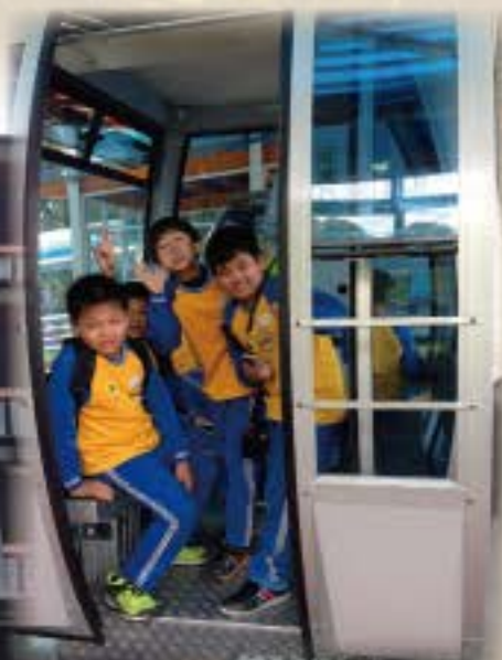
開心坐纜車遊日月潭