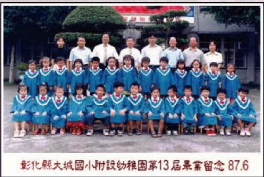
彰化縣大城國小附設幼稚園第13屆畢業留念 87.6