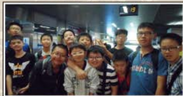
畢業旅行-高雄捷運