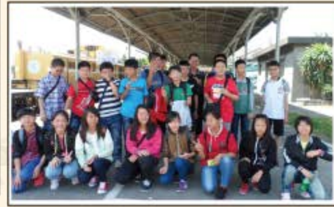
畢業旅行-打狗鐵道文化館