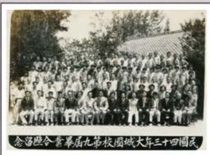
民國三十四年大城國校第九屆畢業生合影紀念