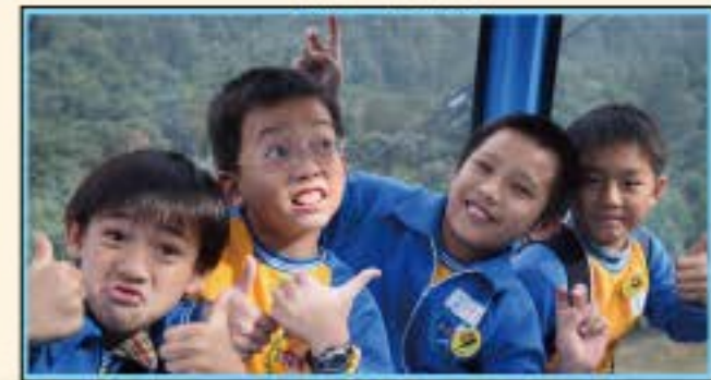
人人都說我們一度贊