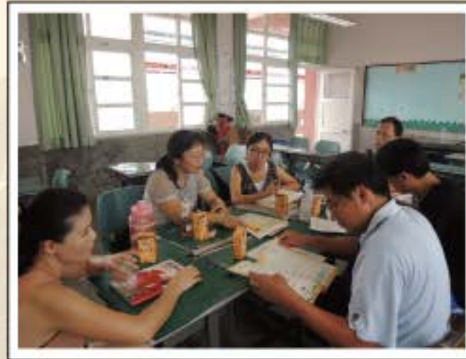
寒暑假教師備課工作坊