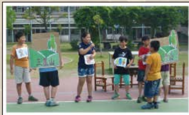
愚公移山-開心演出