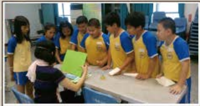
大眾科學日闖關活動