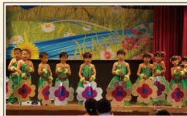
畢業表演活動-花季