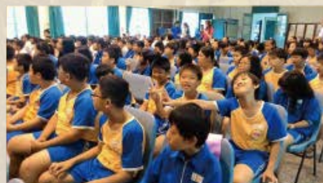
高尚品格自律負責~一場震撼的演講