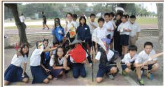
精心裝扮慶祝萬聖節