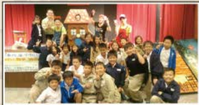
我們和萍蓬草劇團「小房子」演員合照