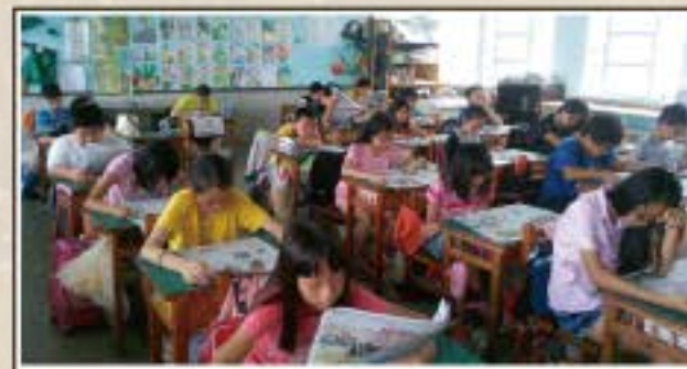
讀報教育-我們可認真了