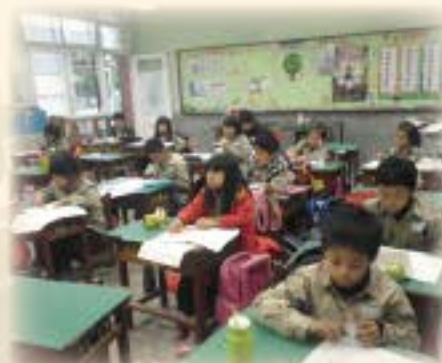
課後照顧認真寫功課