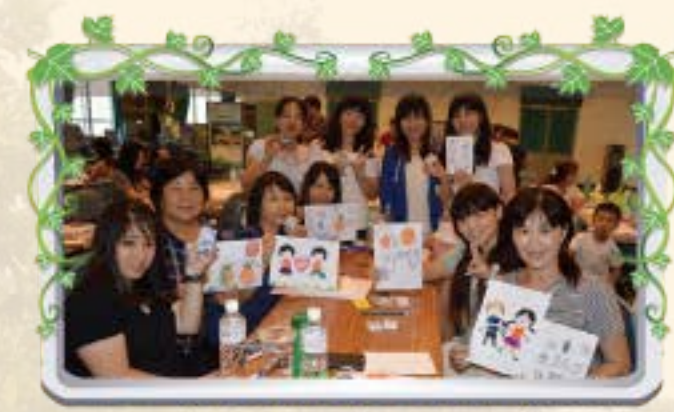
彰化縣104年度教保研習 簡單學刻印--學員精彩作品