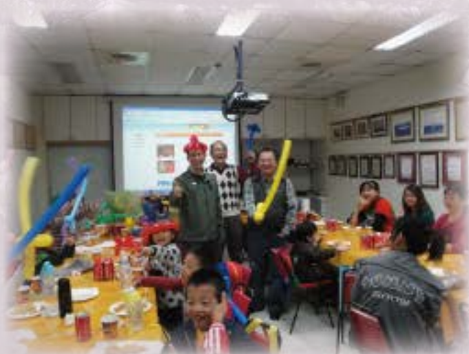
快樂的蕃薯炸雞饗宴