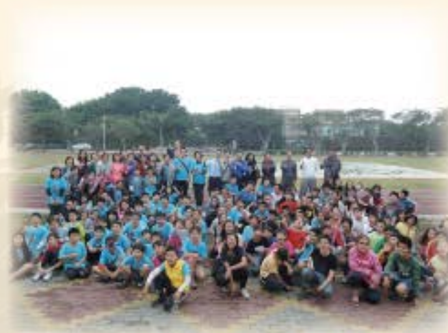
北市敦化國小資優班來訪