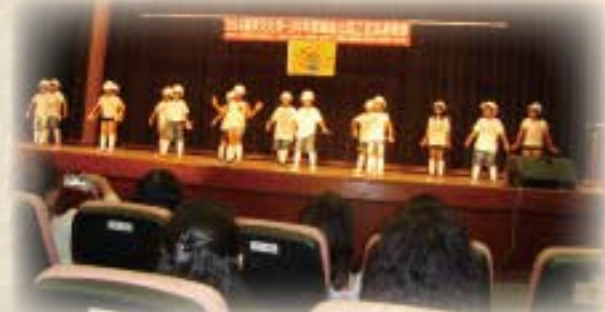
國慶之夜跳舞表演