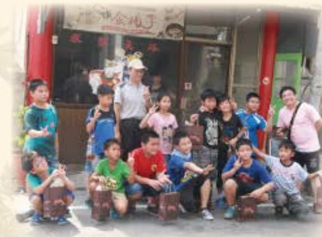
四健會參訪阿南羊肉爐