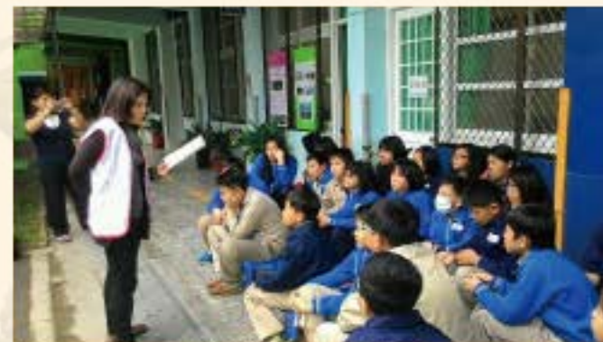
佛光山志工說故事