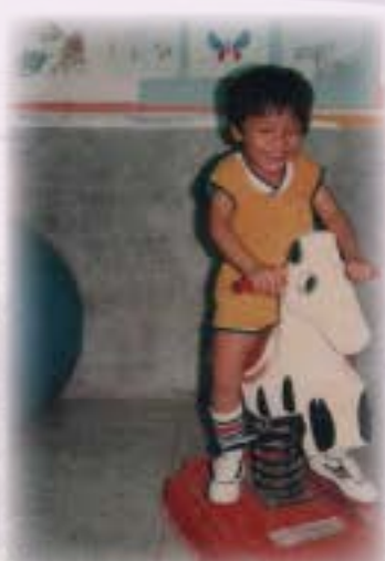
學生的快樂搖搖馬