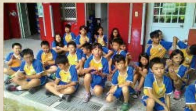
百年校慶~祈福活動