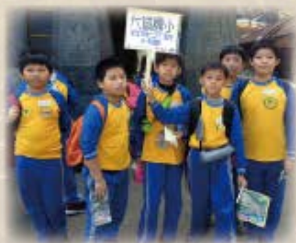
六人小隊準備出發了