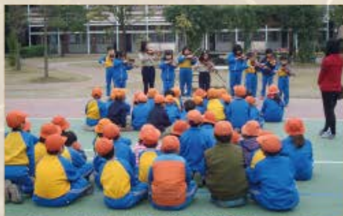
小提琴社團期末演出