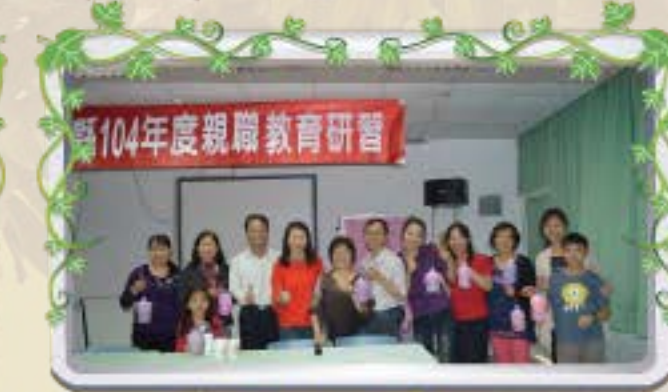
學員完成燈籠後快樂合影