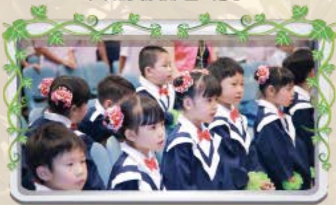
畢業歌響起-祝大家鵬程萬里