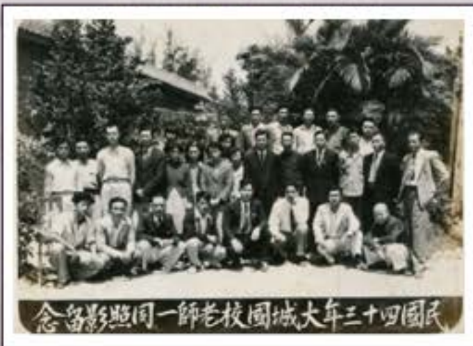
民國三十四年大城國校老師同照紀念