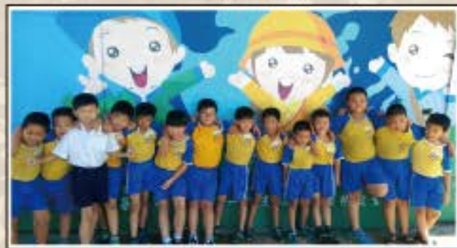
肩並肩我們都是好朋友