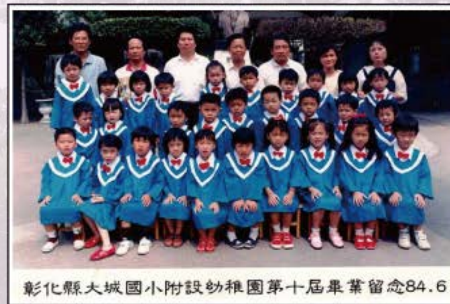
彰化縣大城國小附設幼稚園第十屆畢業留念84.6