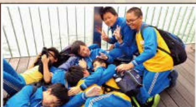
日月潭~玩到累趴了