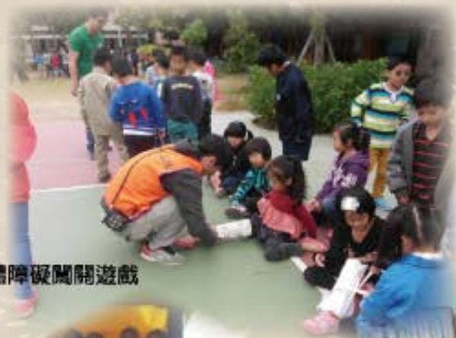
肢體障礙闖關遊戲