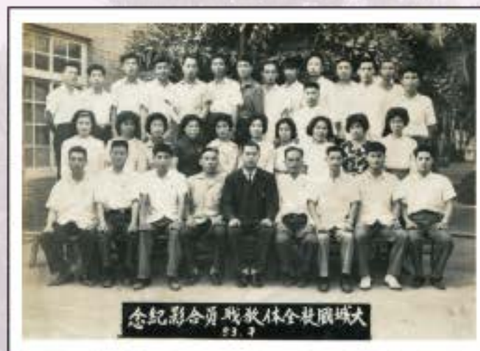
大城國校全體教職員工紀念照