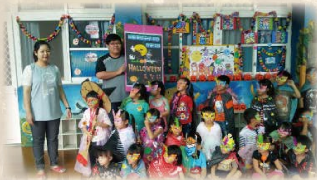
國際節慶教學活動