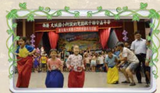
親子嘉年華-袋鼠跳活動