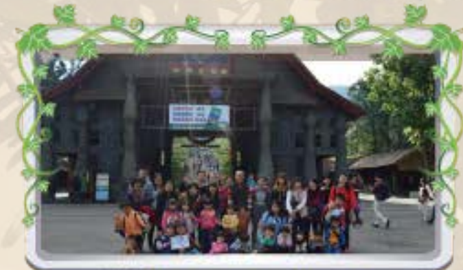
師生於九族文化村合照