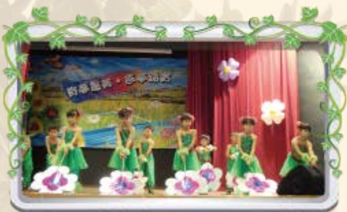
大班表演節目-花季