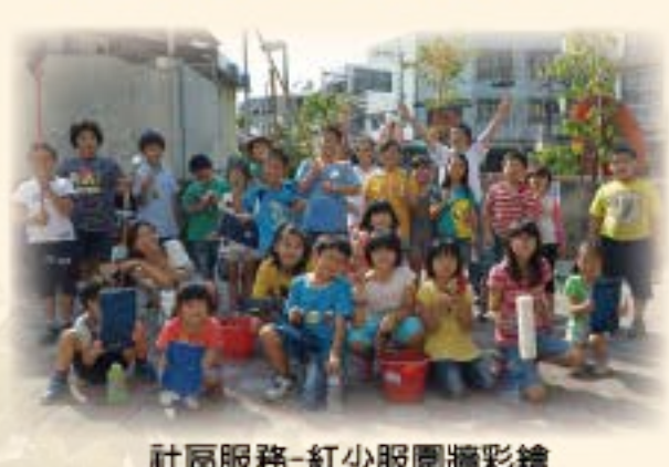
社區服務-紅少服圍牆彩繪