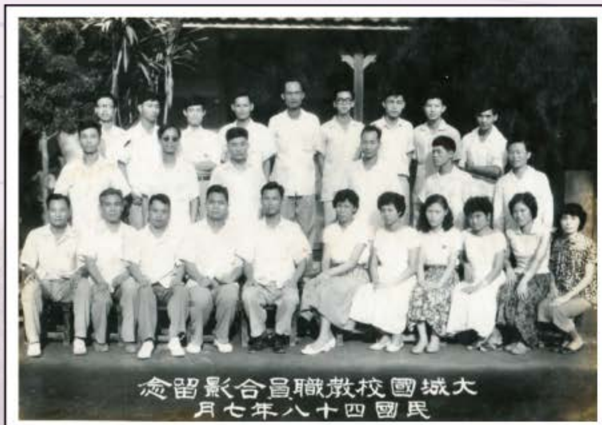
大城國校教職員工合影紀念 民國四十八年七月