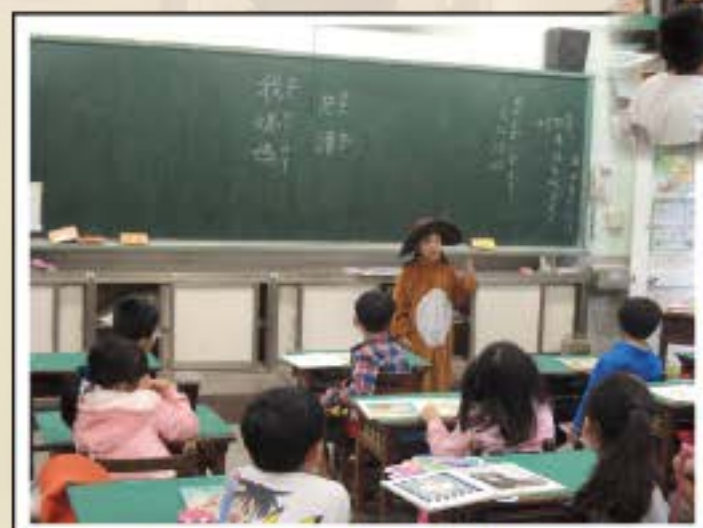
小小說書人到班分享