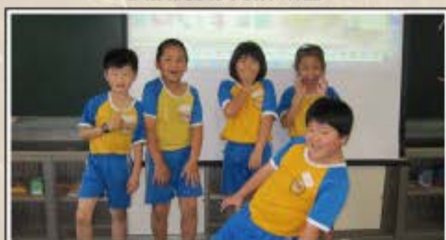
雨天狀況劇滑倒篇