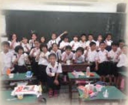
壽星請全班吃點心