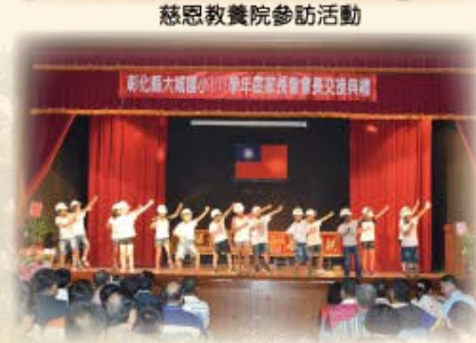
會長交接學生精彩舞蹈表演