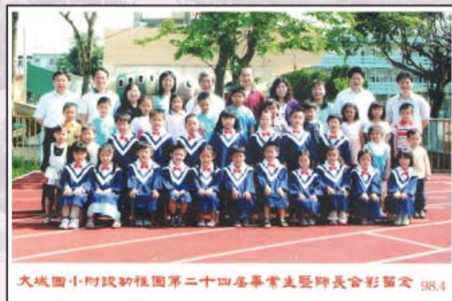
大城國小附設幼稚園第二十四屆畢業生暨師長合影留念 98.4