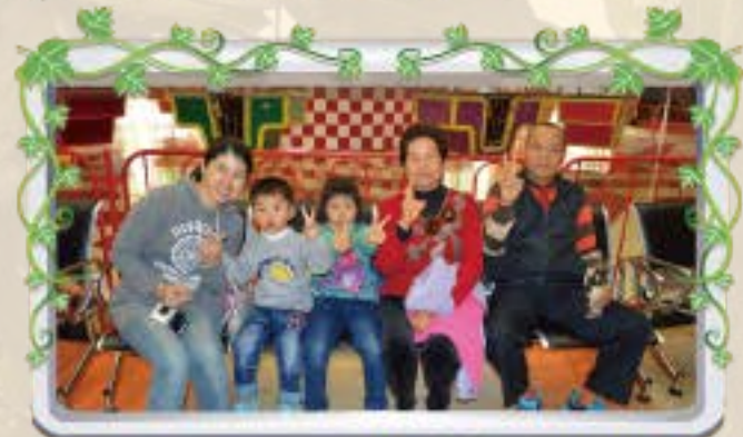
爺爺、奶奶與媽媽陪我們快樂的校外教學