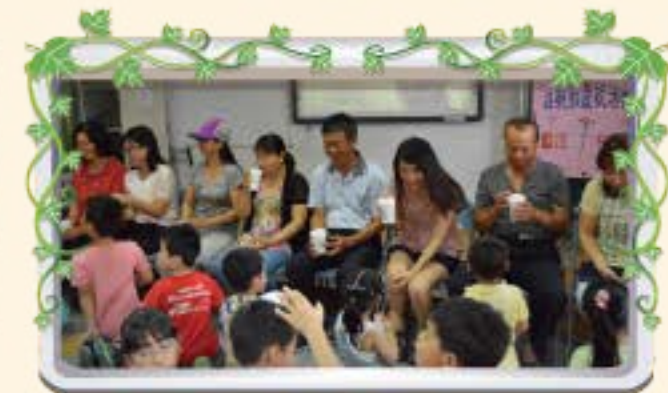
母親節-奉茶感恩活動