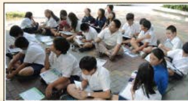
視覺摹寫練習-瞧！我們觀察得多麼認真！