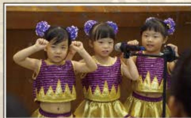
在校生致詞-哥哥姊姊要記得回來哦~