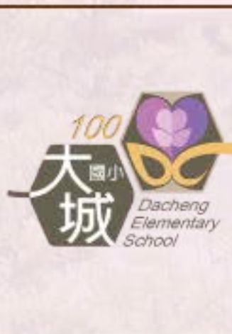
陳競彰 會長 民國66-70學年度