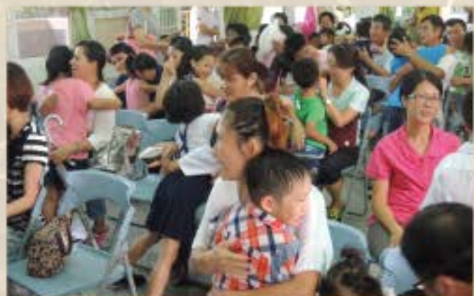
祖父母日愛的抱抱