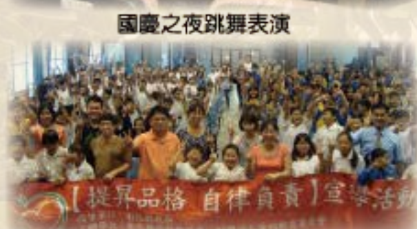
提升品格自律負責宣導