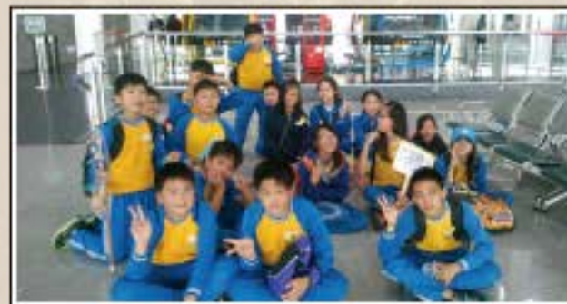
九族文化村校外教學-準備搭纜車囉