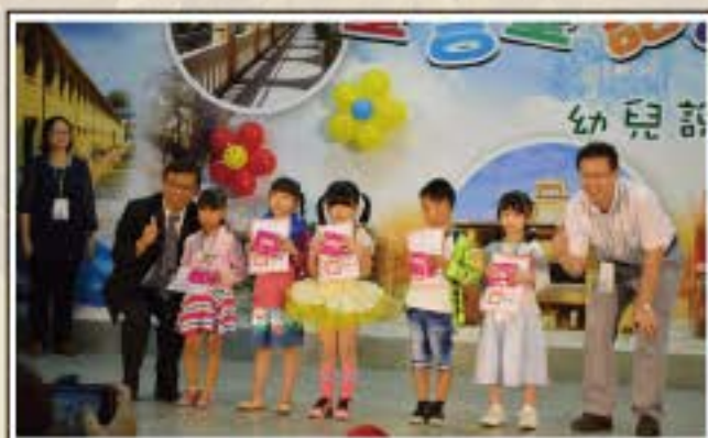
童言童語說故事比賽-謝謝處長與長官的獎品