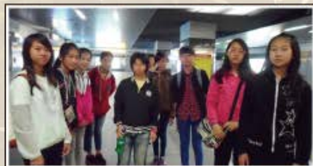
畢業旅行-高雄捷運