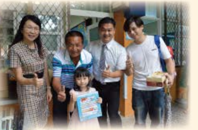
迎新活動-與松圳校長、來坤會長、美惠主任合照