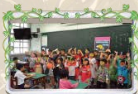
至國小部教室表演律動