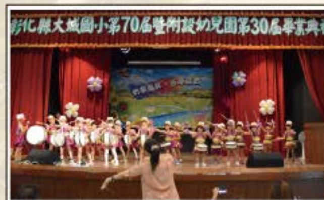
西洋鼓表演-歡樂之歌