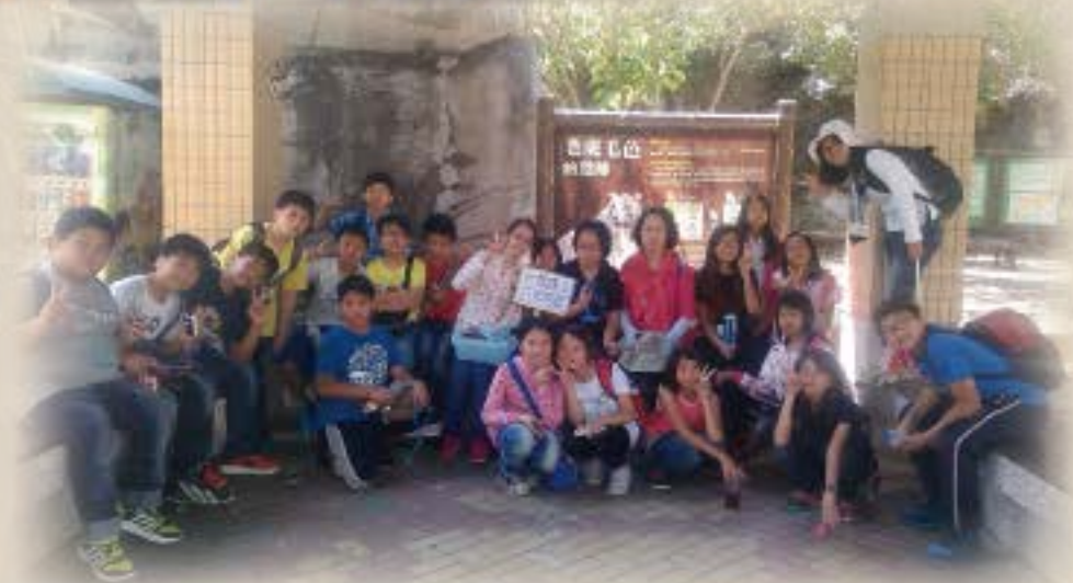
壽山動物園找動物