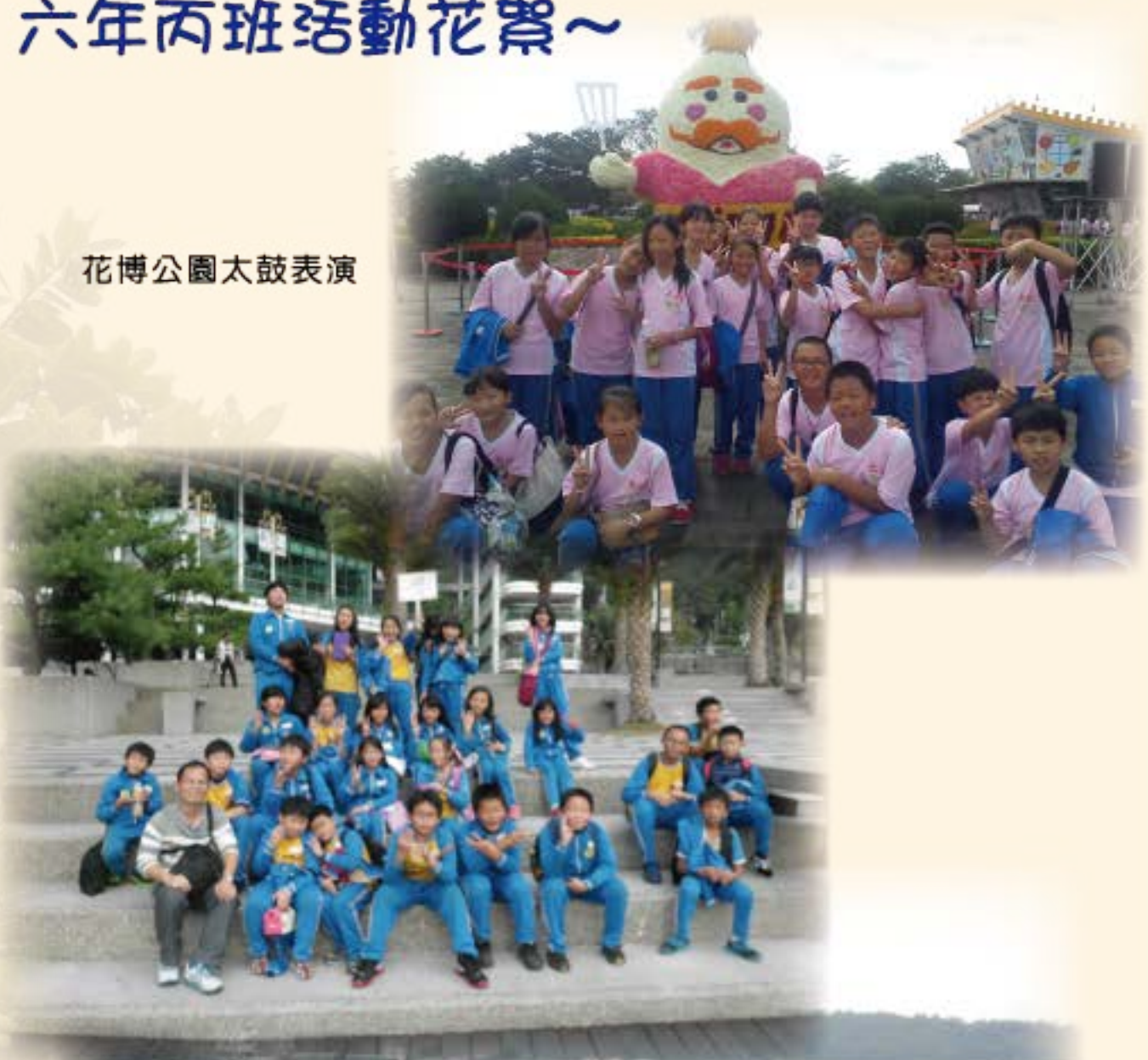
花博公園太鼓表演