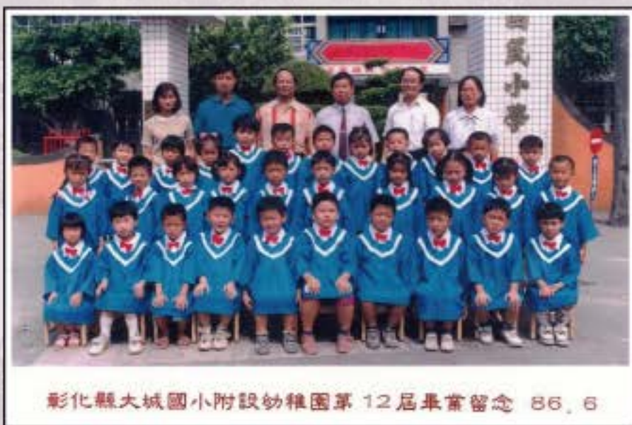
彰化縣大城國小附設幼稚園第 12 屆畢業留念 86. 6