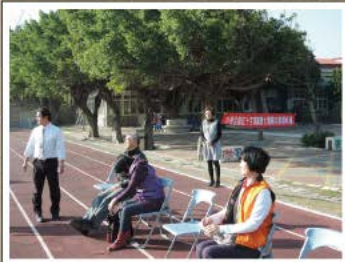
紅十字會太鼓訪視