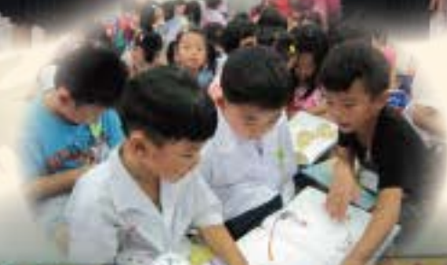
開學首日 好書閱讀