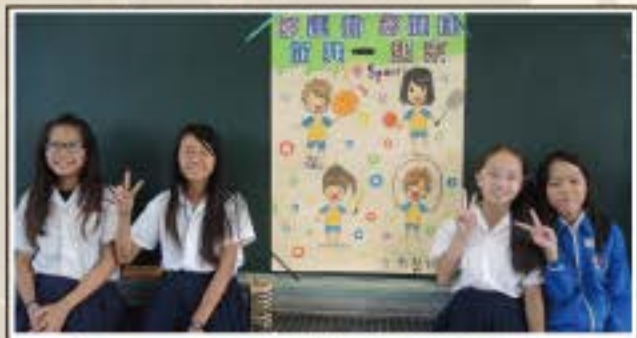
我們努力多時的海報