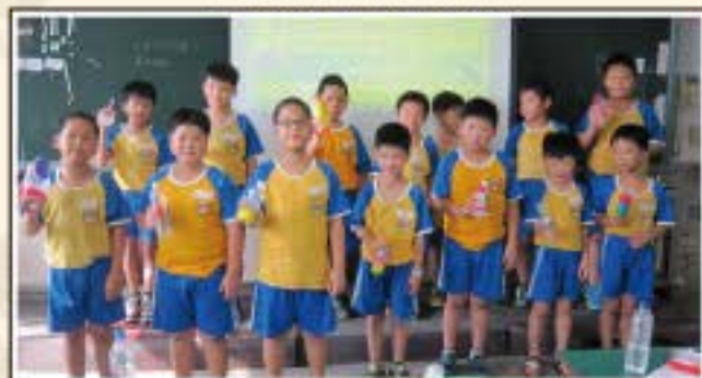
男孩們演奏環保樂器