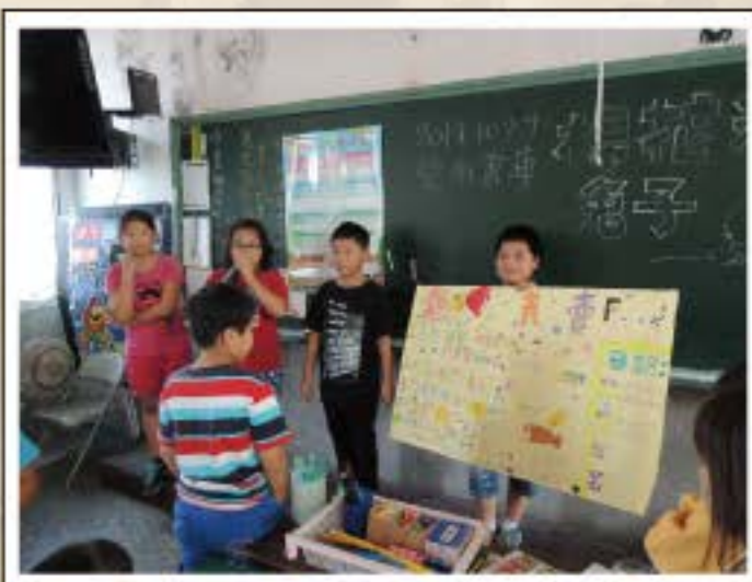
綜合課程之義賣活動