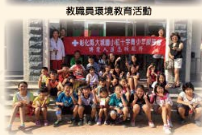
慈恩教養院參訪活動