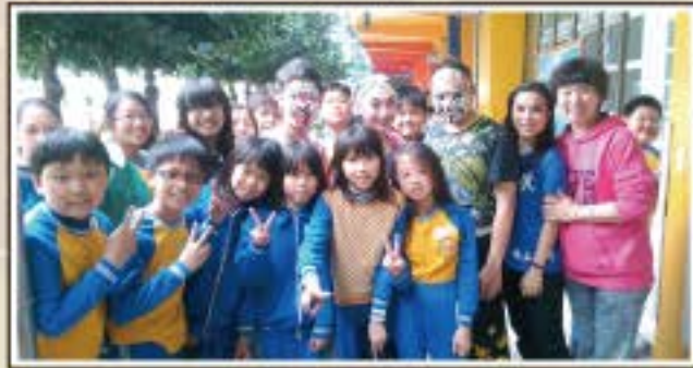
戲曲學校來招生，我們是唯一有合照的班級唷！