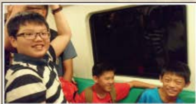
畢業旅行-高雄捷運