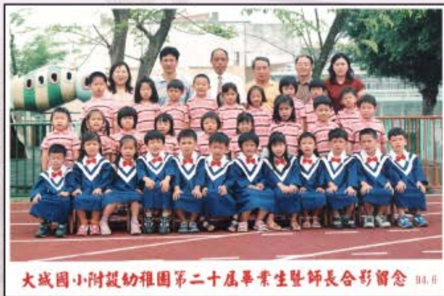
大城國小附設幼稚園第二十屆畢業生暨師長合影留念 94.0