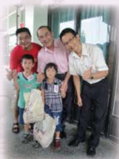
錦廣校長與生發會長 致贈開學禮物