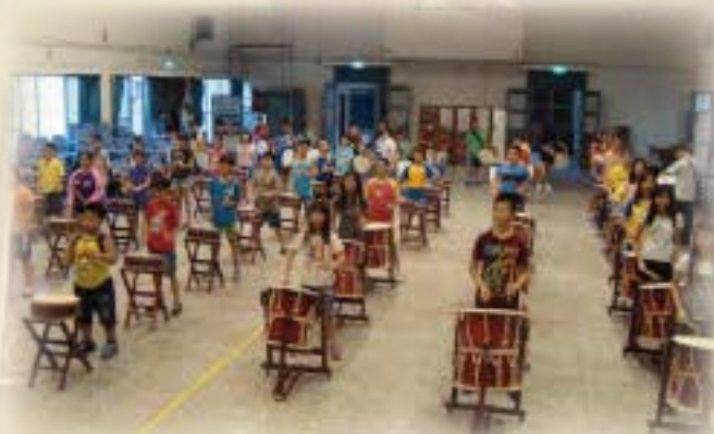
感謝紅十字會贊助各式各樣的鼓 提升學生的藝術涵養