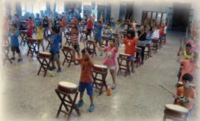
學生暑期勤奮練習