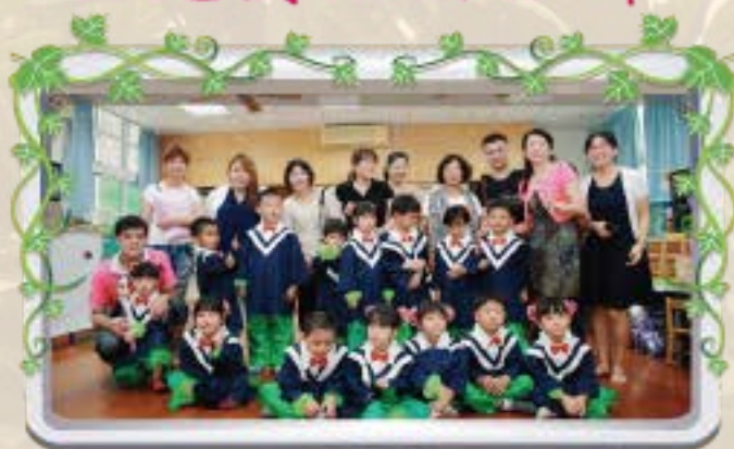
畢業生與老師及家長合照