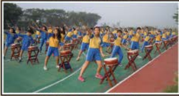
那些年我們一起打的太鼓