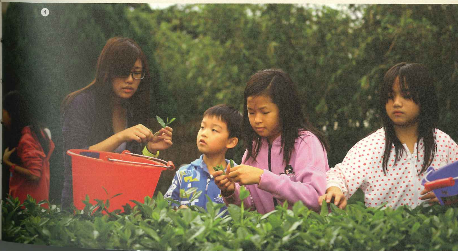
1 漂流木作品 2 陶藝工作室 3 學生陶藝作品 4 老師與學生在茶園實地教學