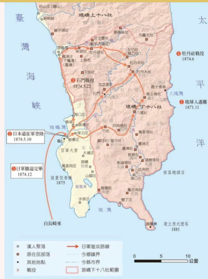
⊙ 牡丹社事件經過圖