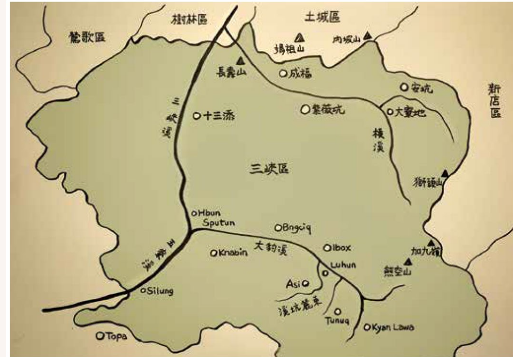
大豹群勢力範圍相關地點示意。(依據大豹社後裔口述，鄭惠敏繪圖)