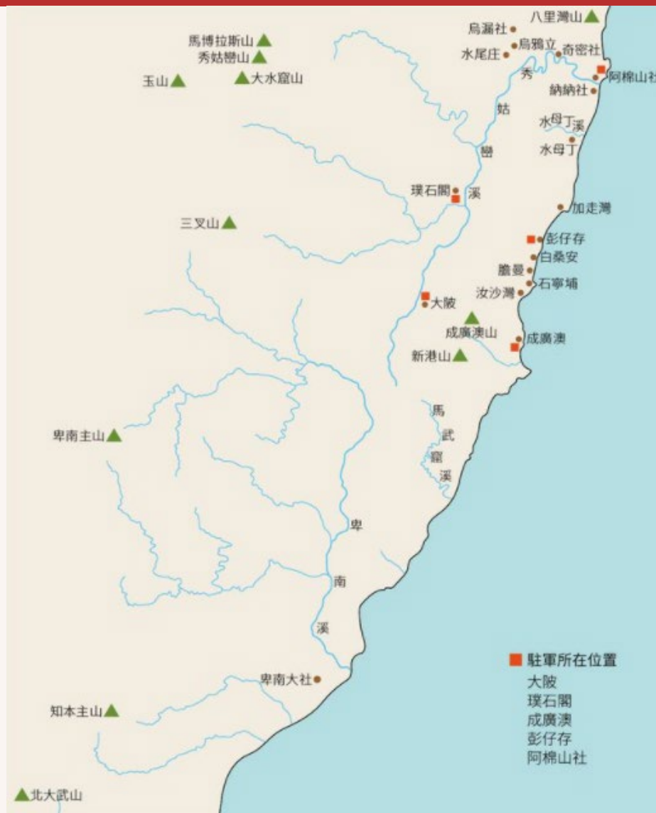
Ⓒ 吳光亮抵後山至「大港口事件」前清軍駐軍分布圖