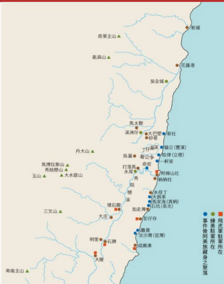
大港口事件後清軍兵區擴張圖