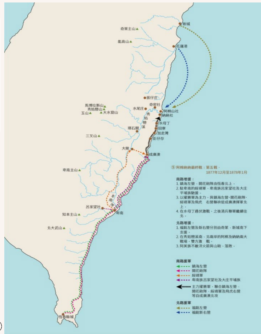
田寮之役清軍行軍路線圖 ⊙