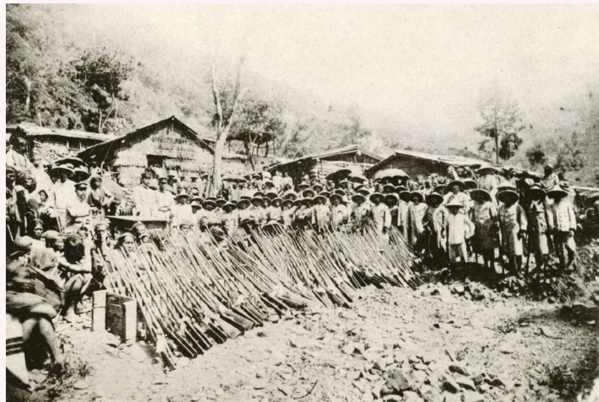
⊕ 大嵙崁後山群在砲彈的威脅下，繳出槍枝。