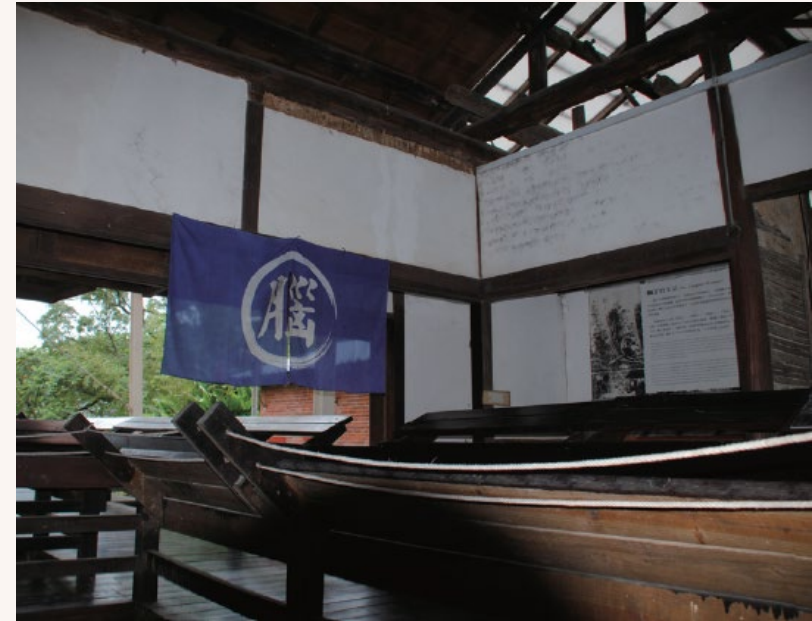
⊕ 復建後的角板山「樟腦收納所」