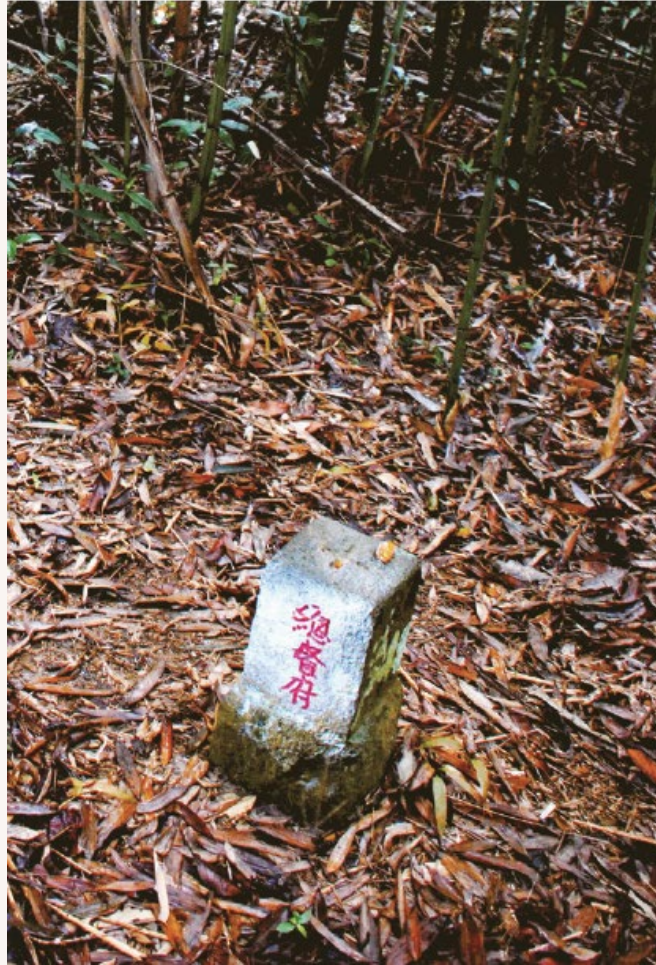
⊕ 枕頭山西峰三角點的歷史遺物